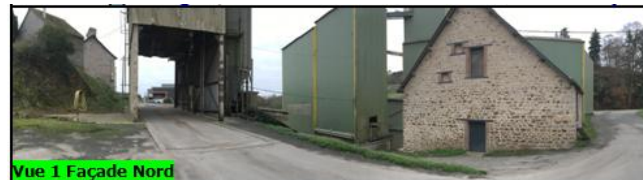
Vue 1 Façade Nord