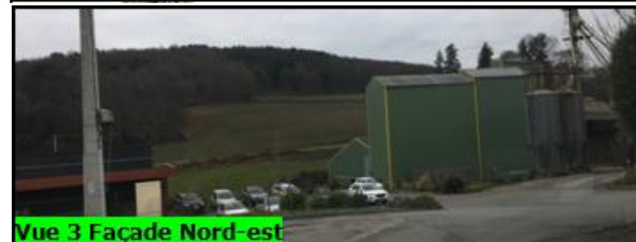
Vue 3 Façade Nord-est