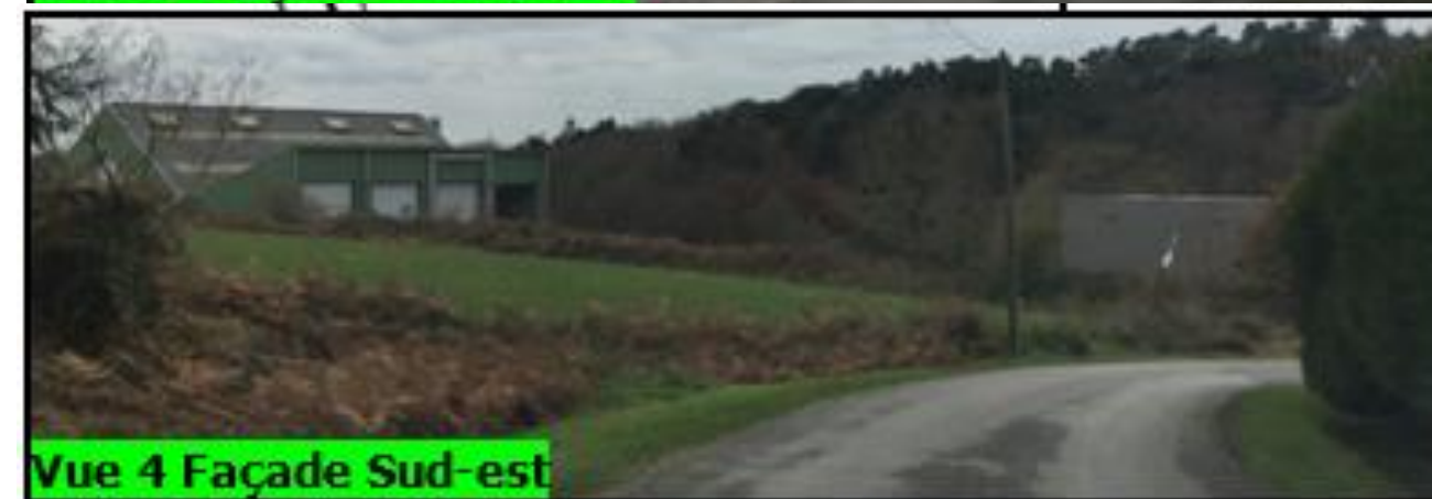
Vue 4 Façade Sud-est