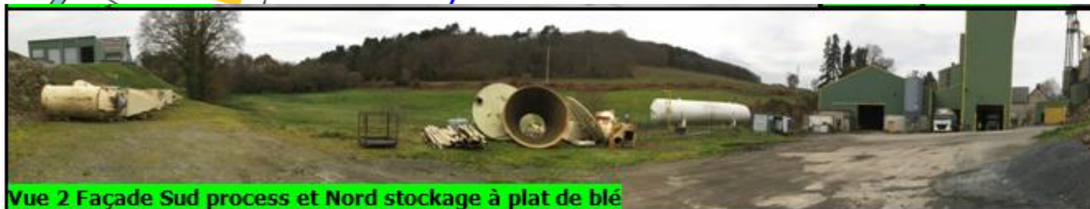
Vue 2 Façade Sud process et Nord stockage à plat de blé