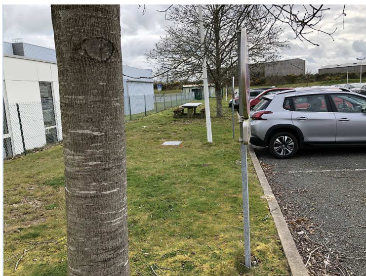
Prise de vue 2 :