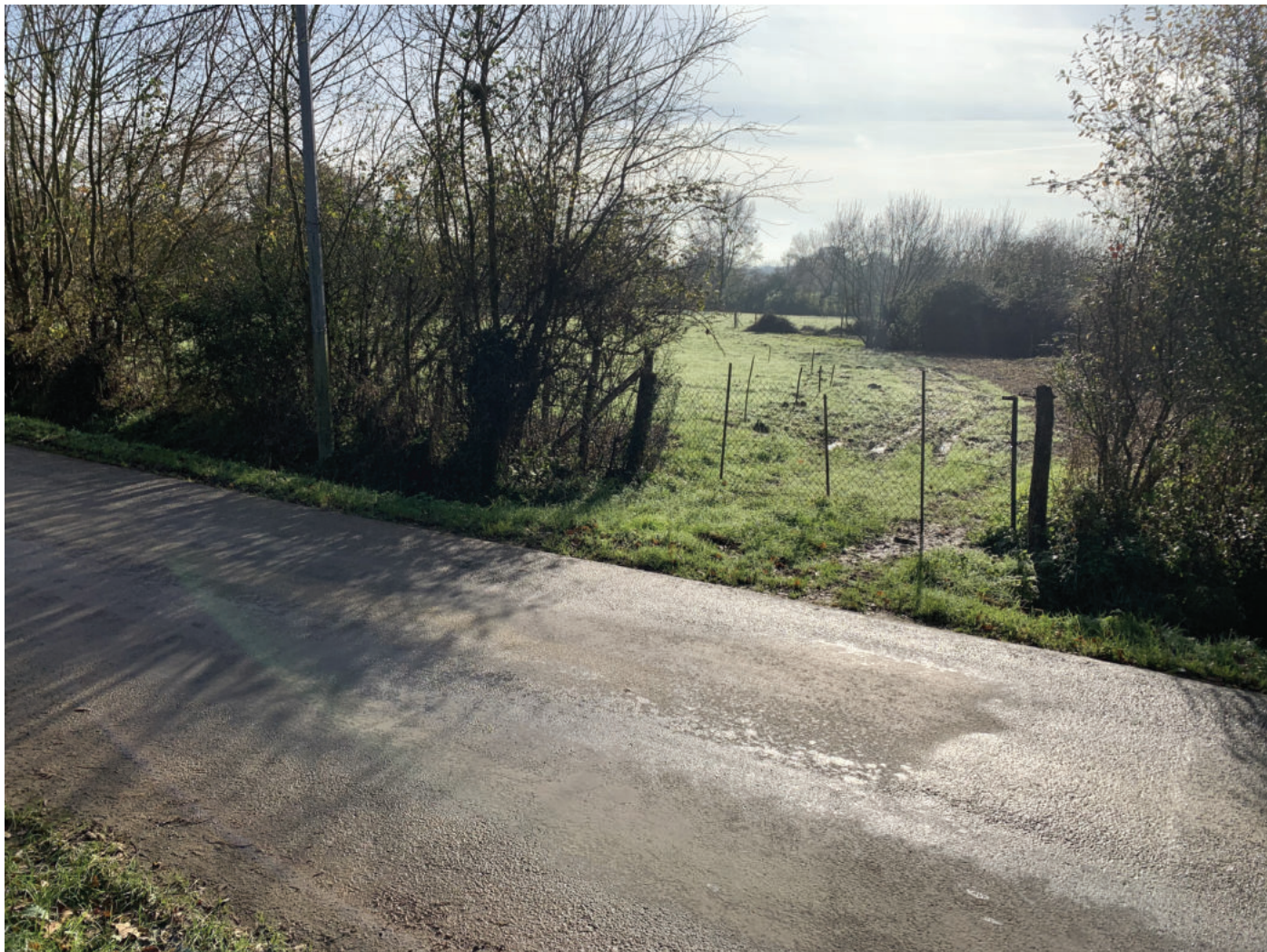
B : Photographie de l'entrée de la parcelle depuis l'espace public.

Références cadastrales de l'unité foncière: 000 AX 14 Surface : 9 500 m 2