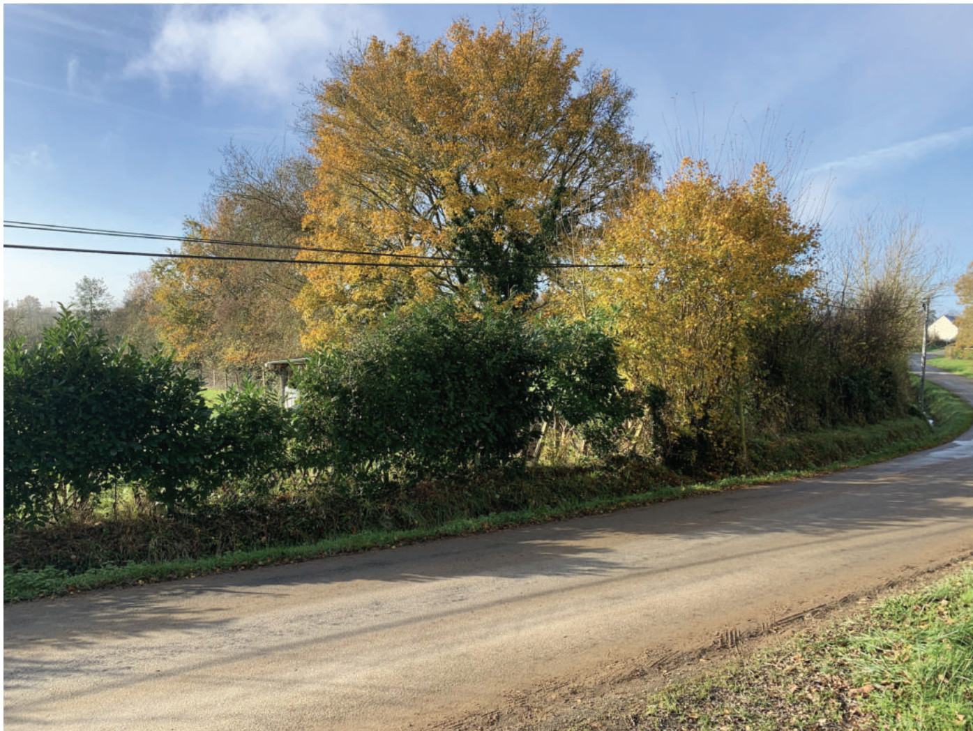
A : Photographie depuis l'espace public. (D615)

Références cadastrales de l'unité foncière: 000 AX 14 Surface : 9 500 m 2