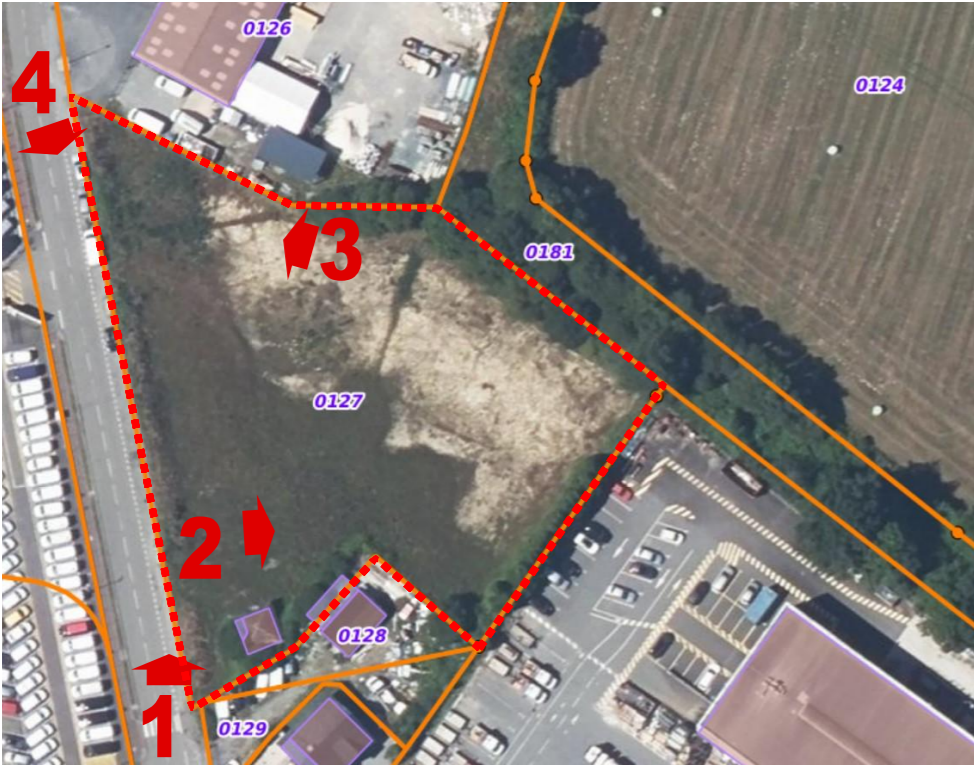
ECHELLE 1/2 500eme