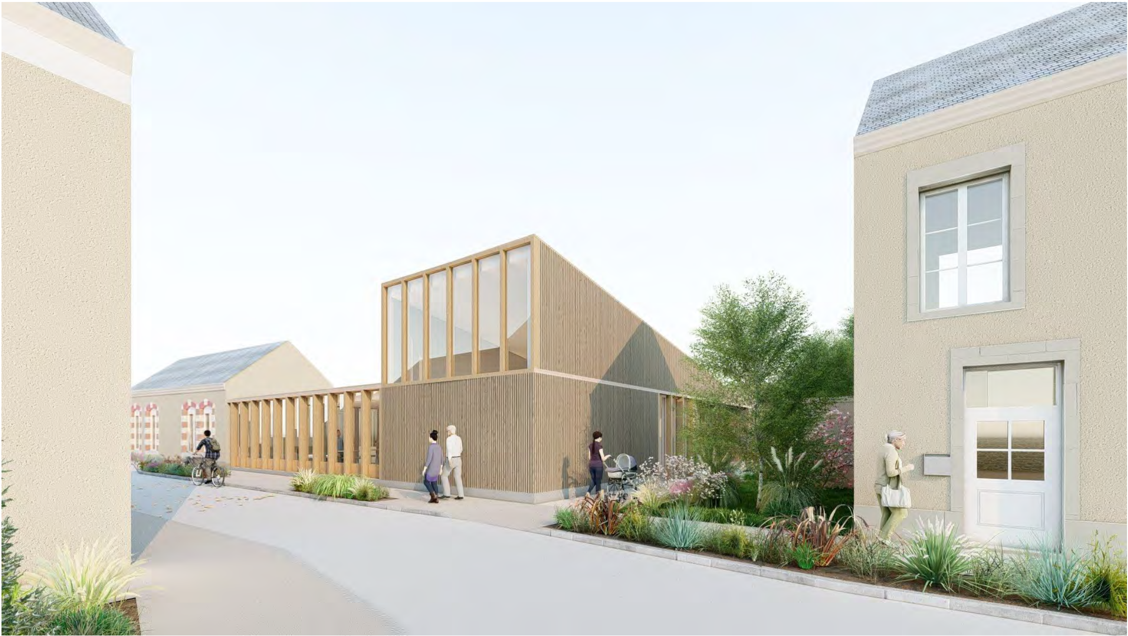
4 - vue bâtiment neuf projeté

Construction d'une médiathèque à Teloché (72)