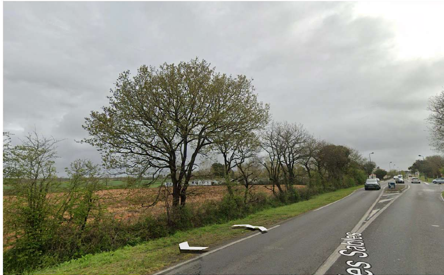
Renforcement de la haie bocagère existante