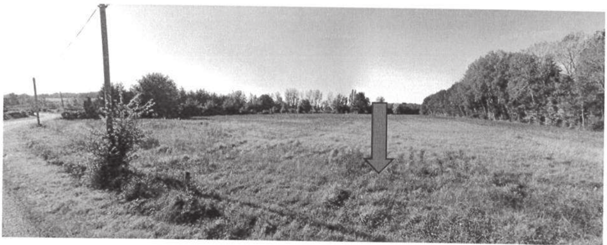
Parcelles 983,1176 le 15 sept 2023