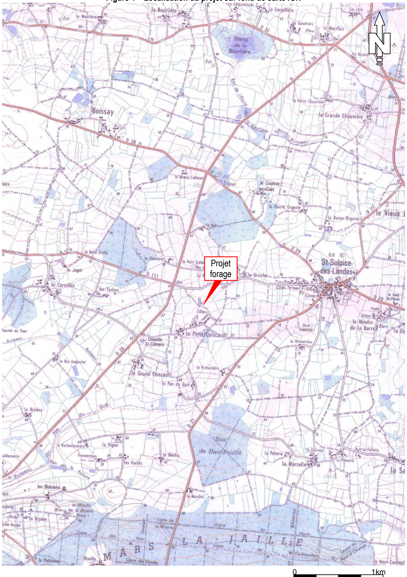
Figure 1 – Localisation du projet sur fond de carte IGN