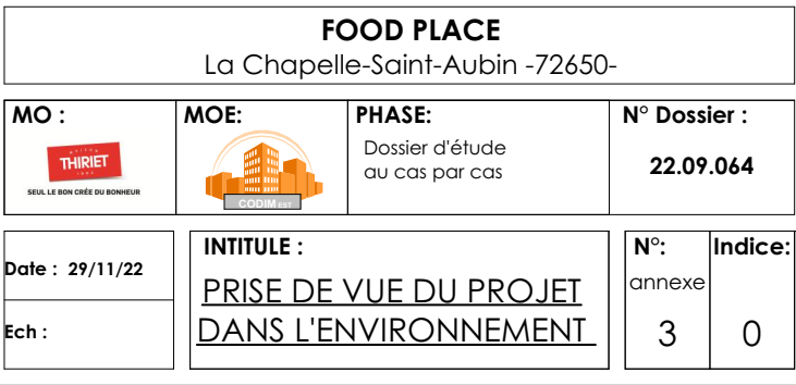
Date de prise de vue : Avril 2022 Coordonnées : 48.036303366559565, 0.17635966951982596