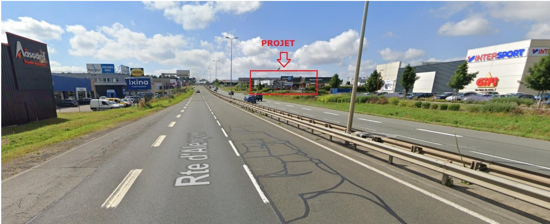
Date de prise de vue : Juin 2022 Coordonnées : 48.03801904410276, 0.17567137651024345