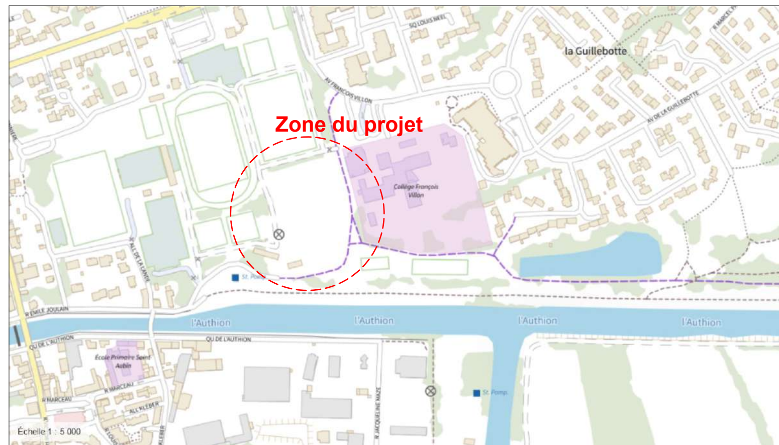
PLAN DE SITUATION - Ech : 1/5000