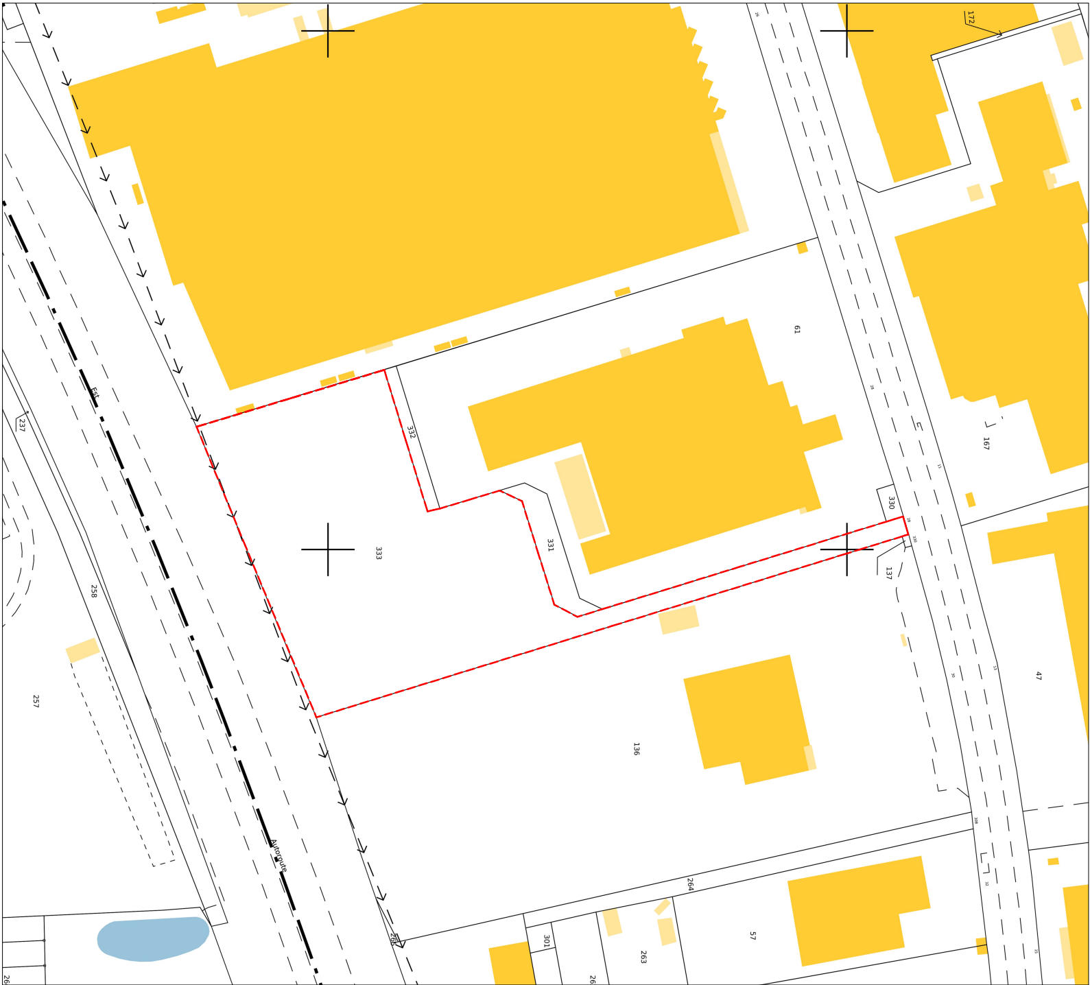
EXTRAIT CADASTRAL - Ech : 1/2000

REFERENCE CADASTRALE DU PROJET : Ecoflant (49000) 000 AC 0333 / 11 564 m²