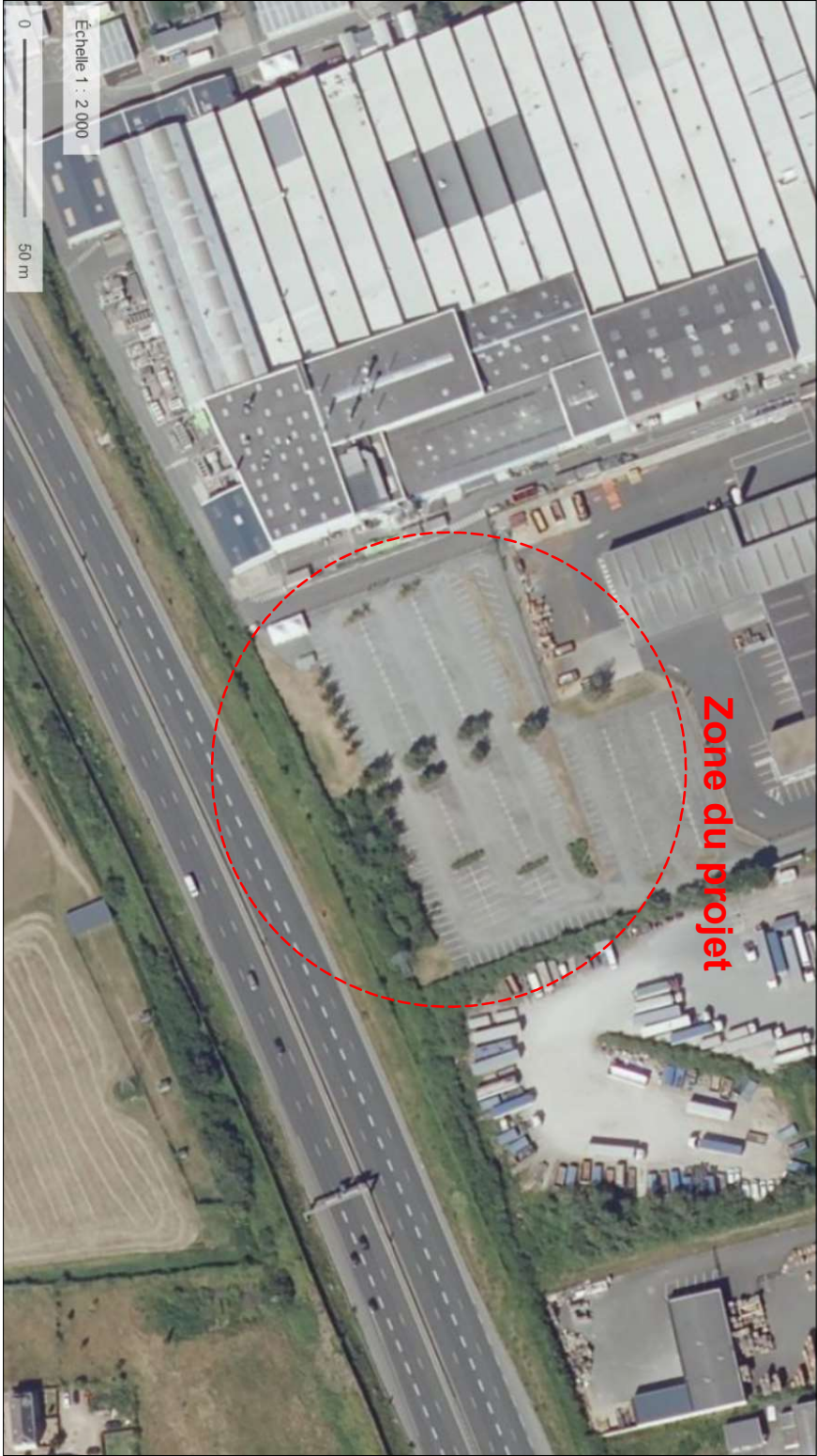
VUE AERIEENNE - Ech: 1/2000

Ombrières en panneaux photovoltaïques 28 Boulevard de l'Industrie 49000 Ecoflant