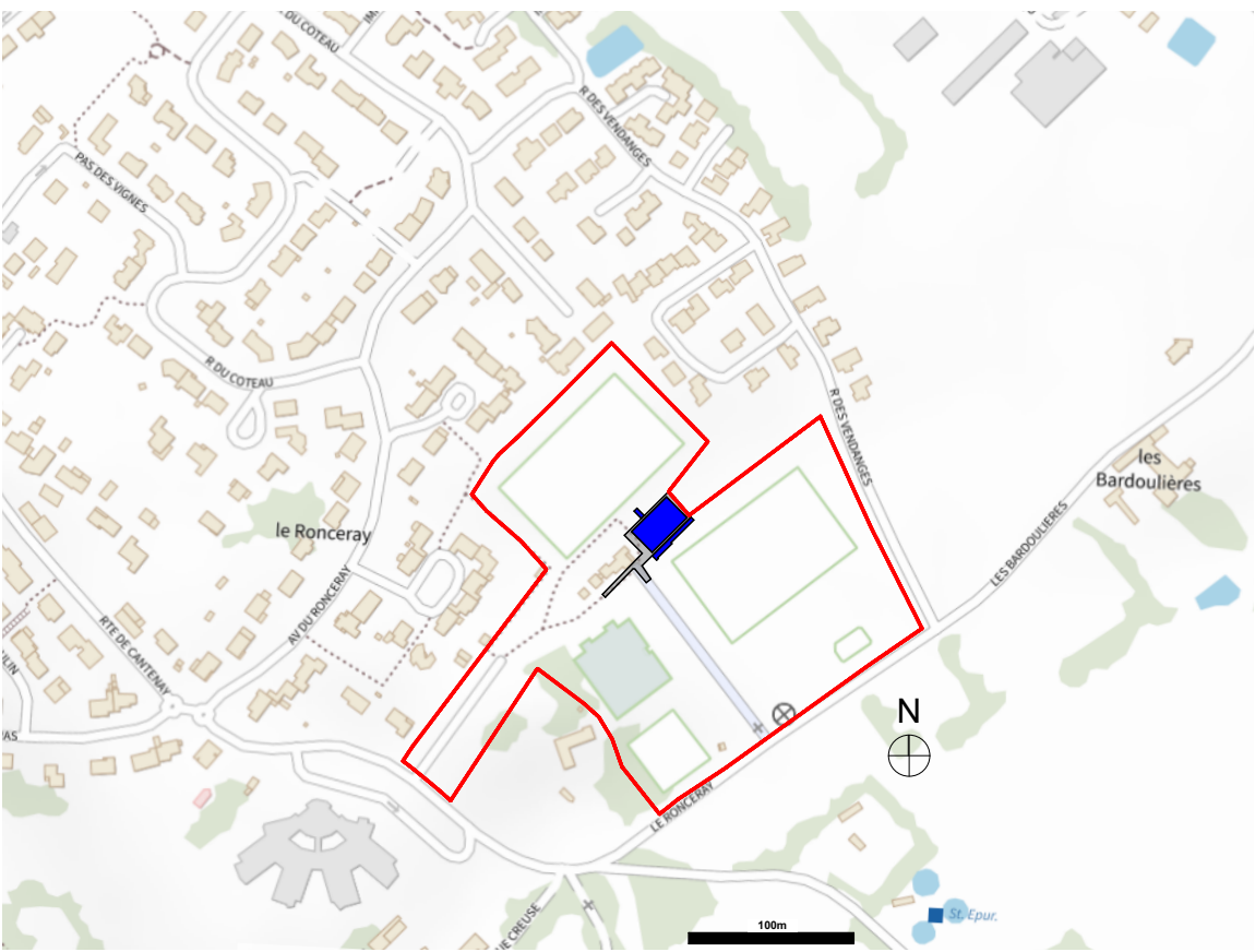
échelle : 1/5000