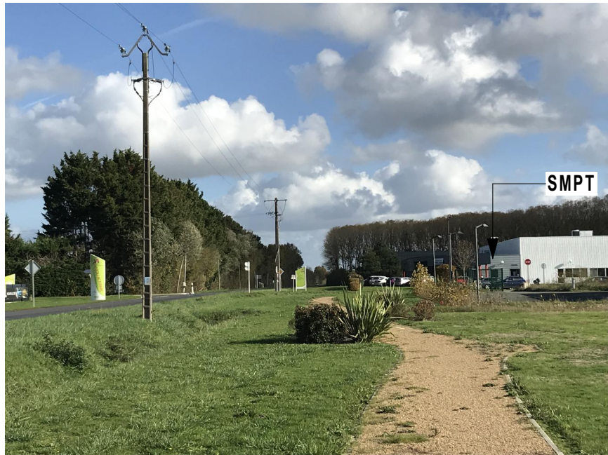
4 PHOTOGRAPHIE DU SITE VUE DU CHEMINEMENT PIETON EXISTANT