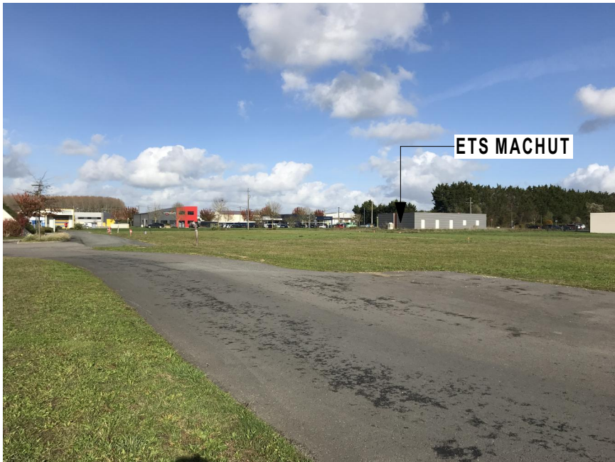
2 PHOTOGRAPHIE DU SITE VUE INTERNE DE ZONE