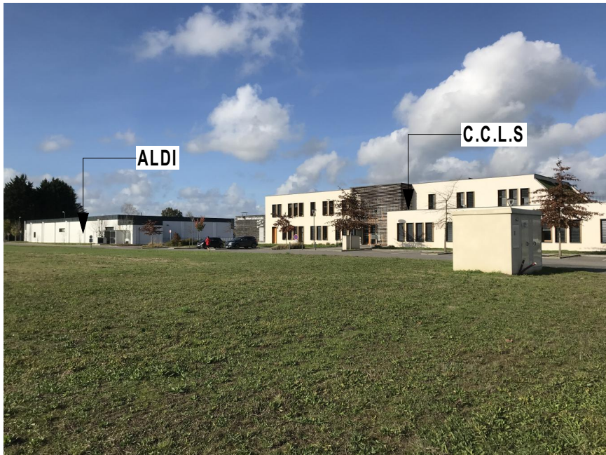
3 PHOTOGRAPHIE DU SITE VUE INTERNE DE ZONE (C.C.L.S)