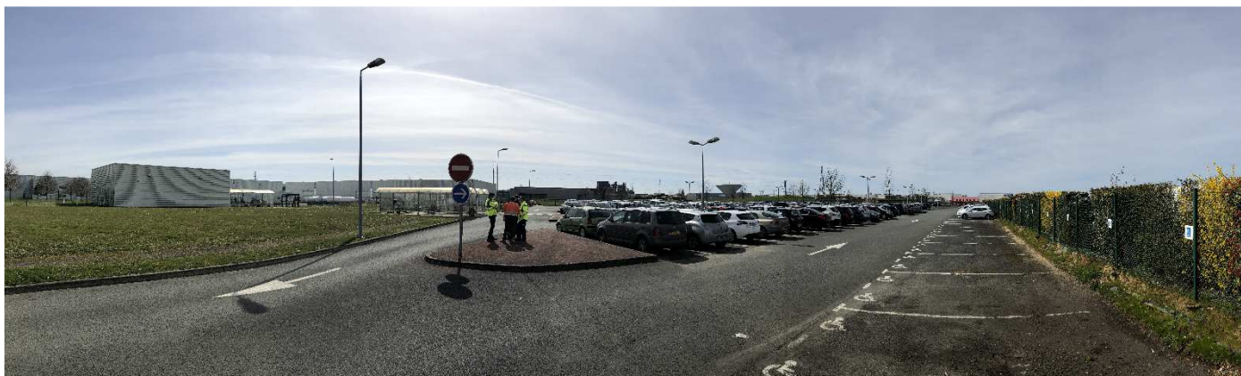
Prise de vue 2 :