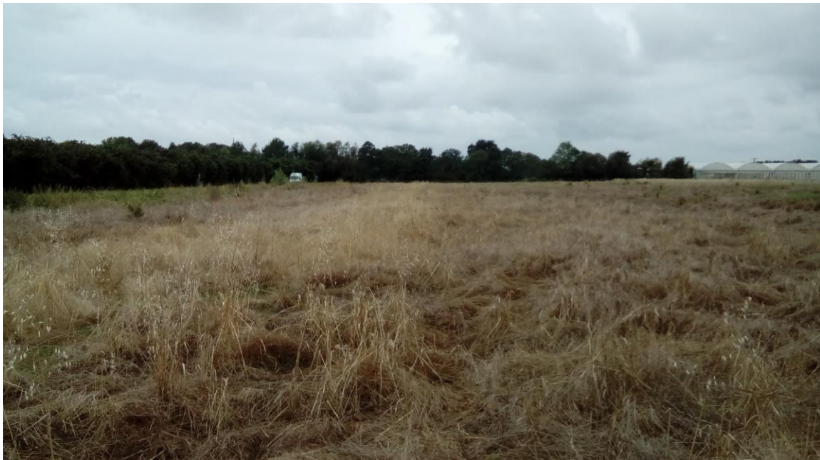
P2 : Vue vers l'ouest depuis l'est