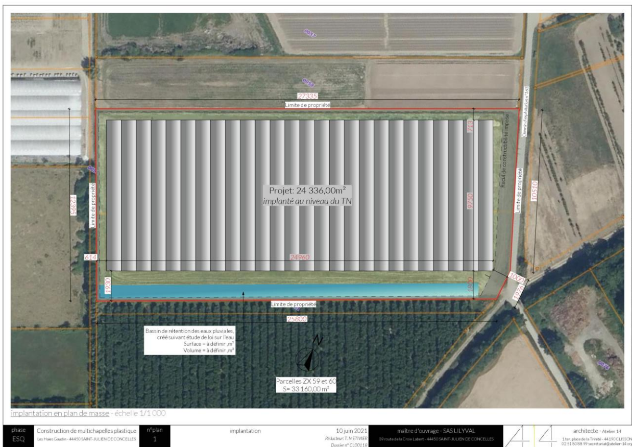
Plan extrait du permis de construire réalisé par le cabinet d'architecture Atelier 14