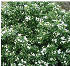
Choisya ternata ( Oranger du Mexique )