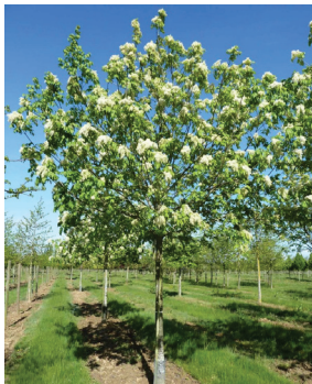
Fraxinus ornus ( Frêne à fleurs )