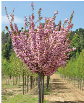
Prunus serrulata ( Cerisier du Japon )