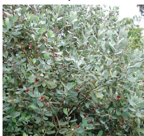
Feijoa sellowiana ( Goyavier du Brésil )

Semi-persistant 1,8m Floraison juillet-oct.