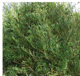
Phillyrea angustifolia ( Filaire )