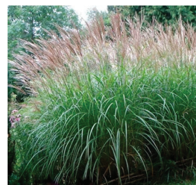
Miscanthus sinensis ( Roseau de Chine )