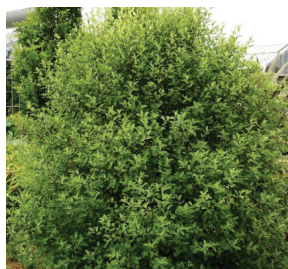
Pittosporum tenuifolium ( Pittospore )