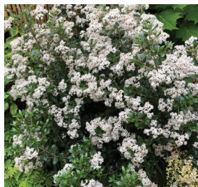
Olearia x haastii ( Aster en arbre )