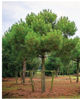
Pinus pinea ( Pin parasol )