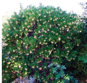
Arbutus unedo ( Arbousier )