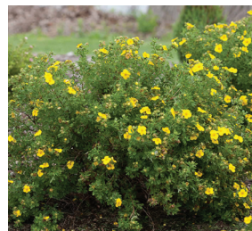
Potentilla fruticosa ( Potentille )