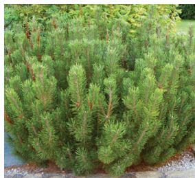
Pinus mugo ' Pumilio '