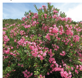
Nerium oleander ( Laurier rose )