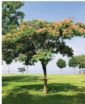
Albizia julibrissin ( Albizia )

Arbres tiges plantés en isolé le long des voies et entre emplacements.