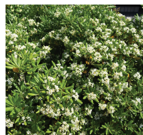
Pittosporum tobira ( Pittospore )