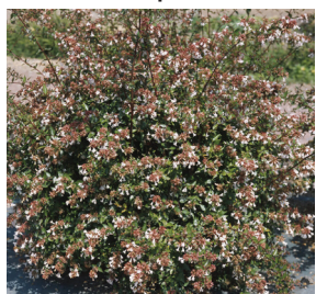
Abelia x grandiflora ( Abélia )

Arbustes plantés entre les emplacements afin de délimiter les espaces et cacher des vis-à-vis.