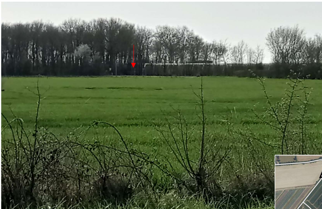
Vue de l'environnement lointain du forage