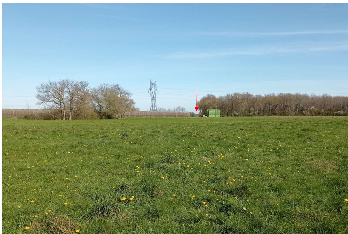
Vue de l'environnement lointain du forage