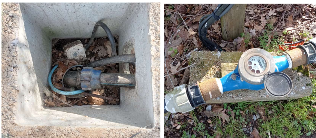
Tête du forage et margelle (photo de gauche) et compteur d'eau (photo de droite)