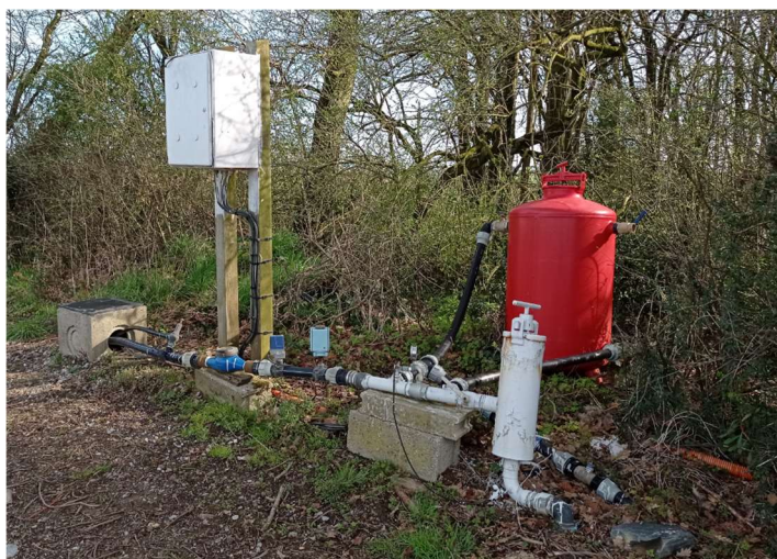
Vue de l'installation de pompe