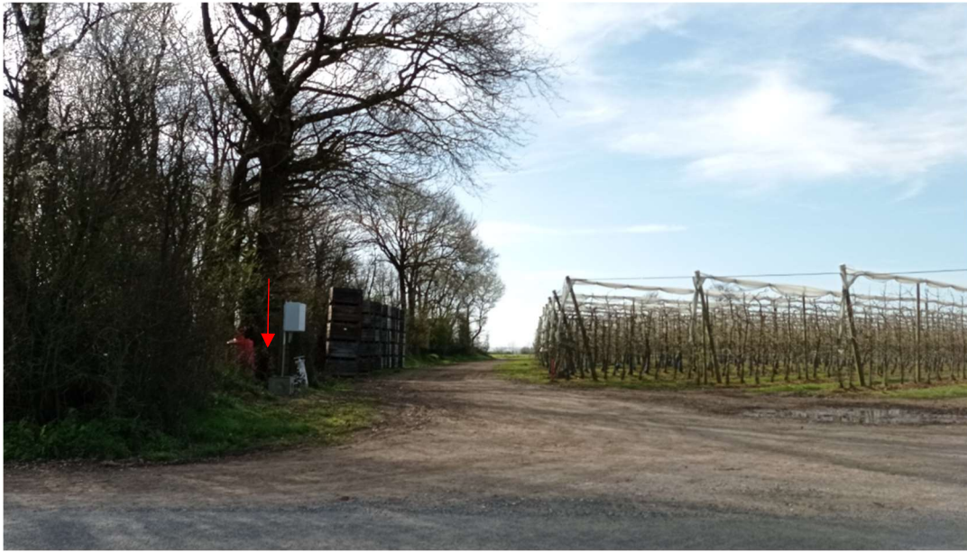
Environnement proche du forage : parcelle forestière à gauche, route communale en premier plan et vergers à droite