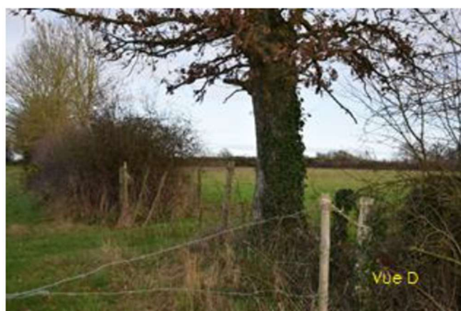
Figure 3 : Vues du site dans un environnement proche