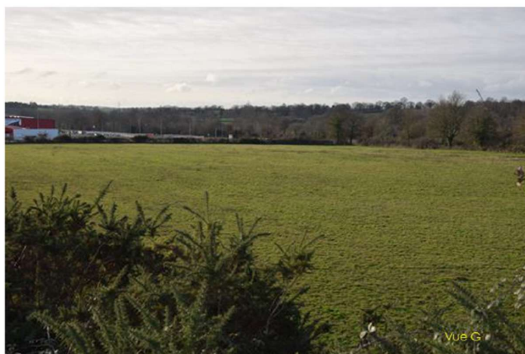
Figure 4 : Vues du site dans un environnement lointain