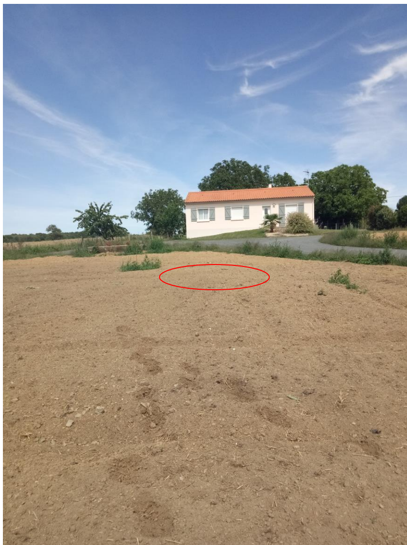
Figure 1 : Prise de vue du futur forage

Renseigner les tableaux ci-dessous, en fonction de vos connaissances, et joindre une cartographie de localisation approximative des milieux et espèces .