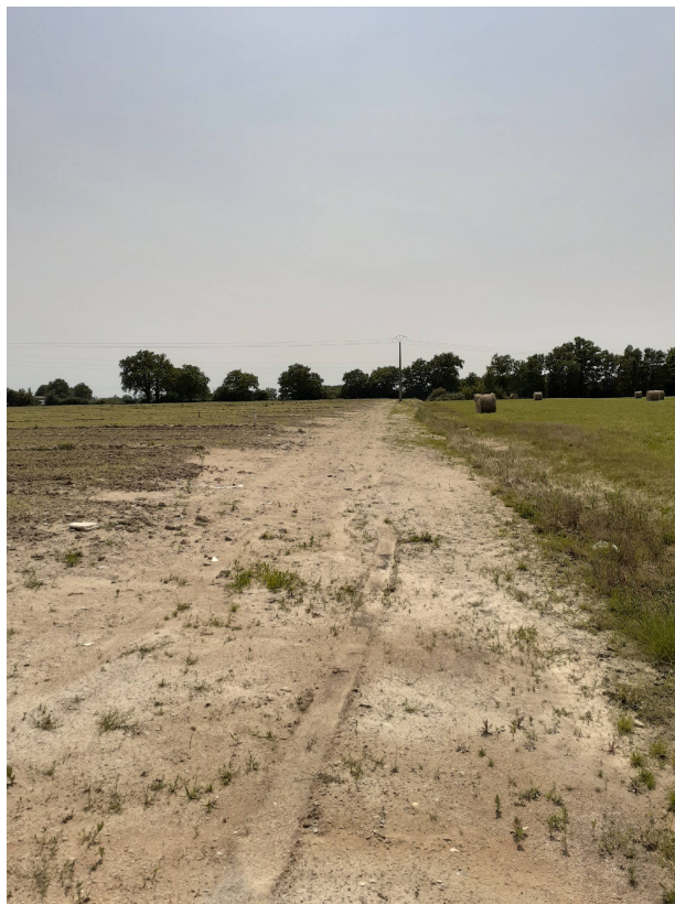
P2 : Photo du site via la pointe nord