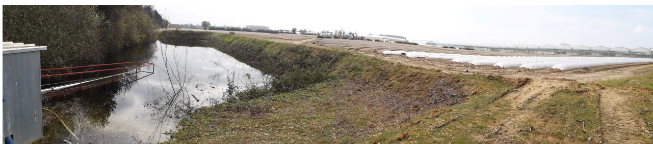
P6 : Photo du chemin d'accès limite ouest du site (serres mitoyennes 3847E)