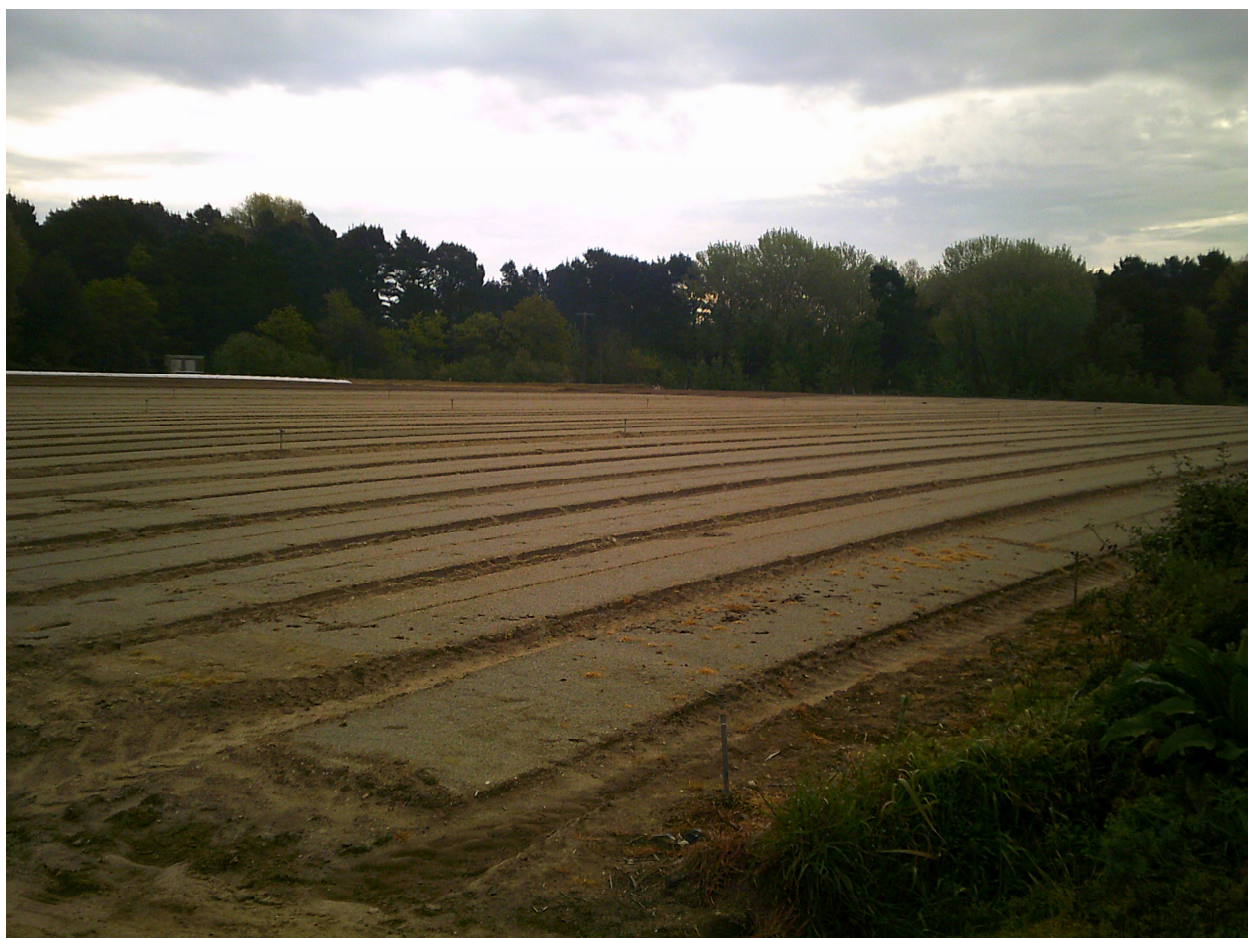
P1 : Photo du site via l'angle sud-ouest parcelle 32E