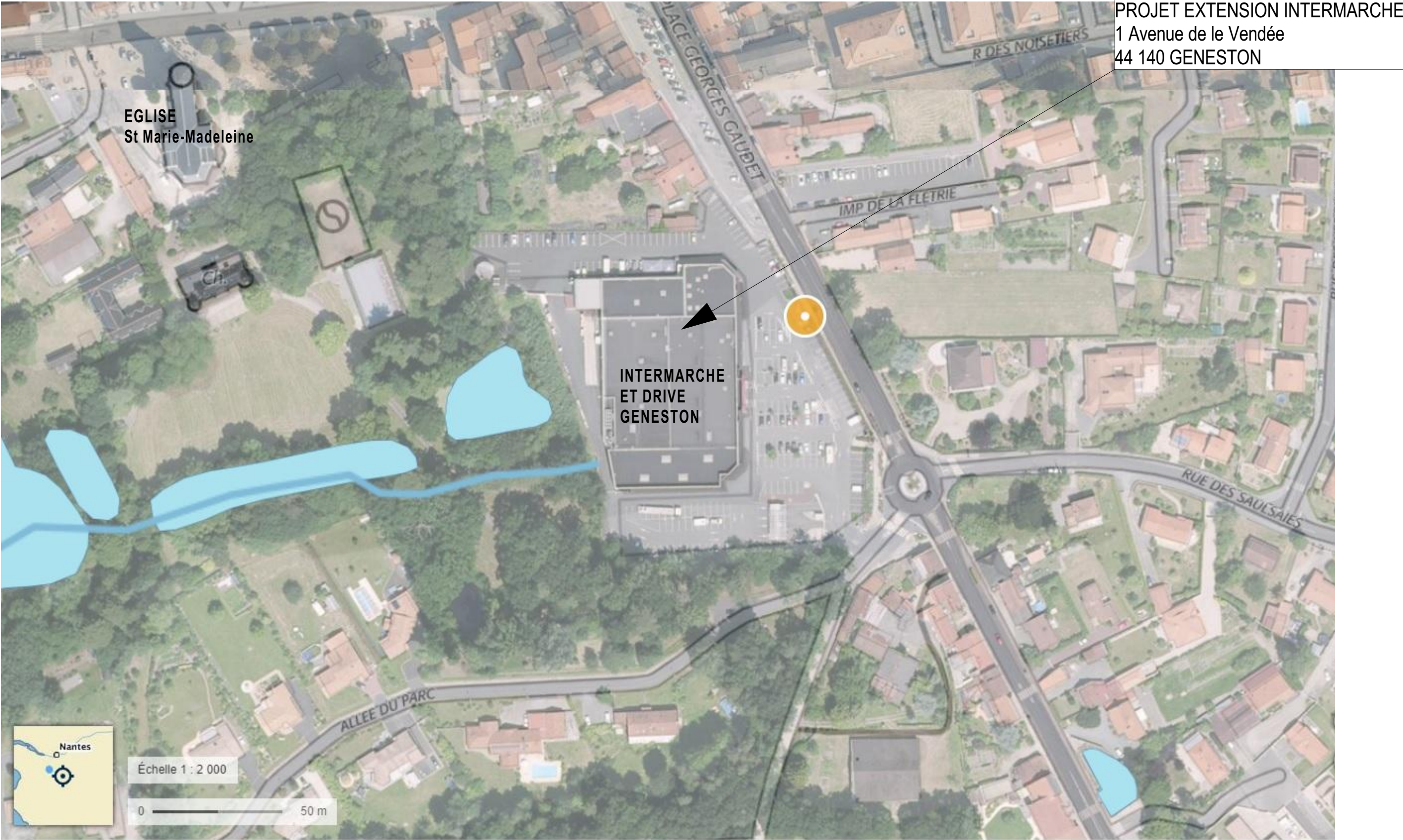
Plan de situation 1 2000