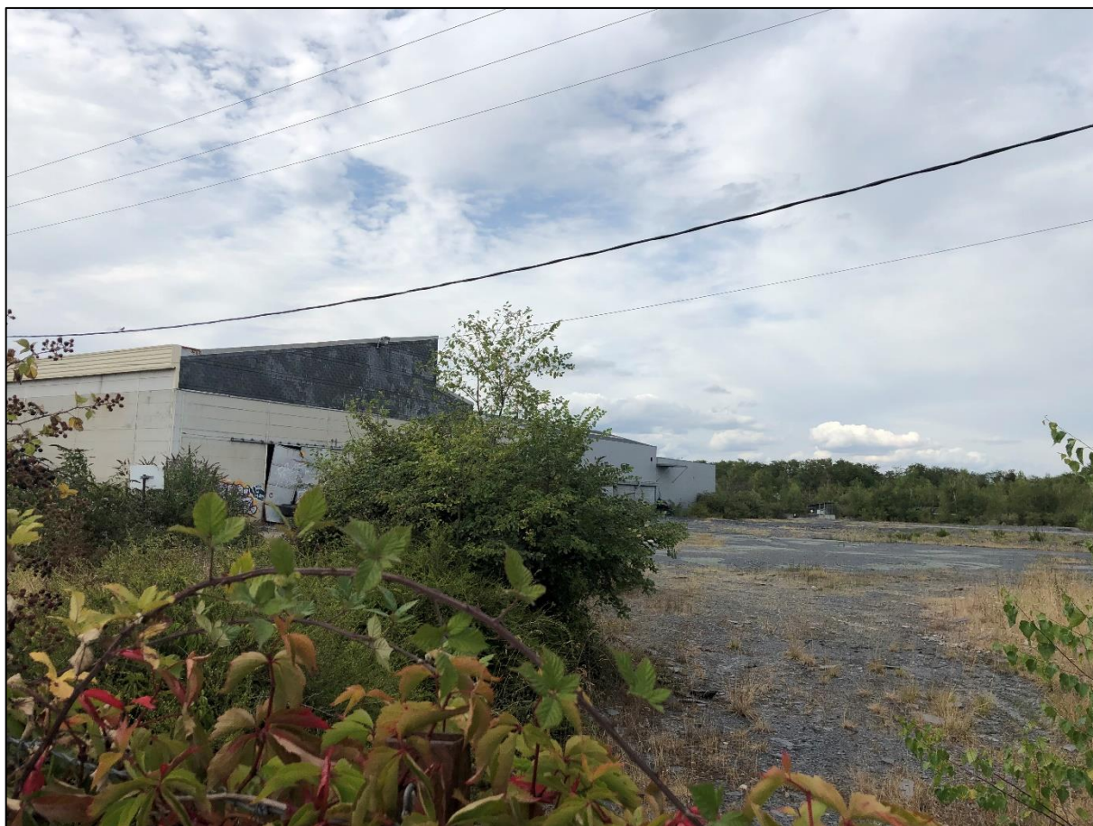
Figure 3 : Prise de vue du site n°2