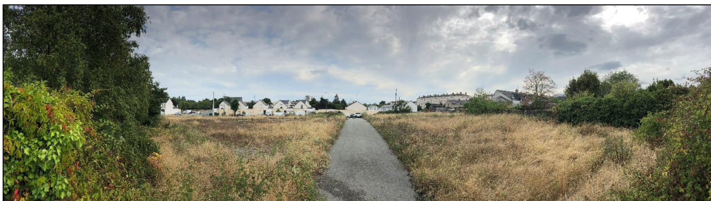
Figure 4 : Prise de vue du site n°3 - Source : QuaranteDeux