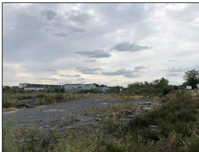
Figure 2 : Prises de vue du site n°1