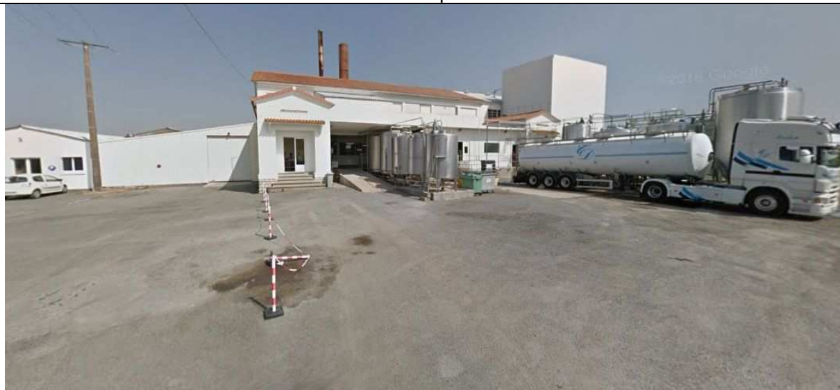
1 - Site Union Laitière de la Venise Verte