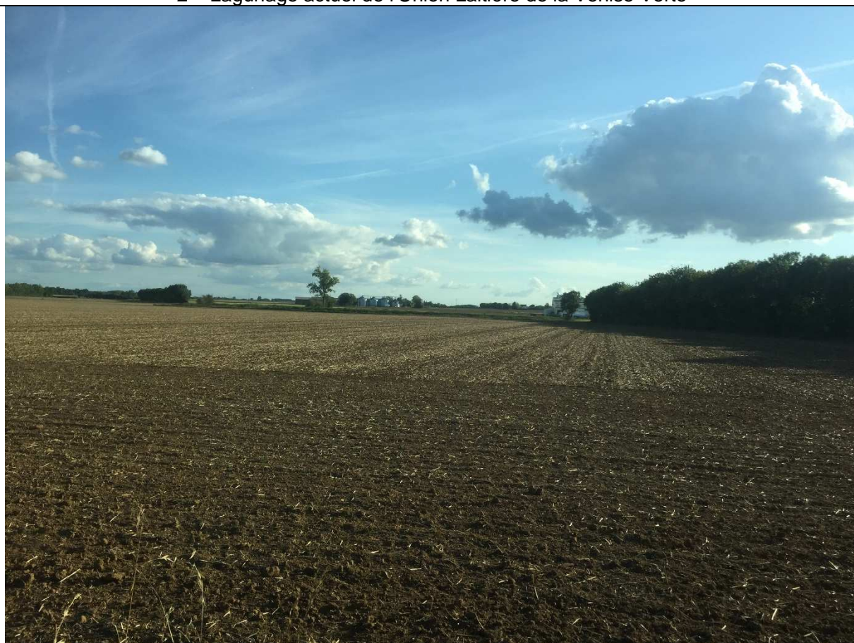
3 – Union Laitière de la Venise Verte

Parcelle du plan d'épandage – vue depuis la route communale au nord de la parcelle GG2 (avec Union Laitière de la Venise Verte à Maillezais – Cerfa n°14734*03 – Annexe 3