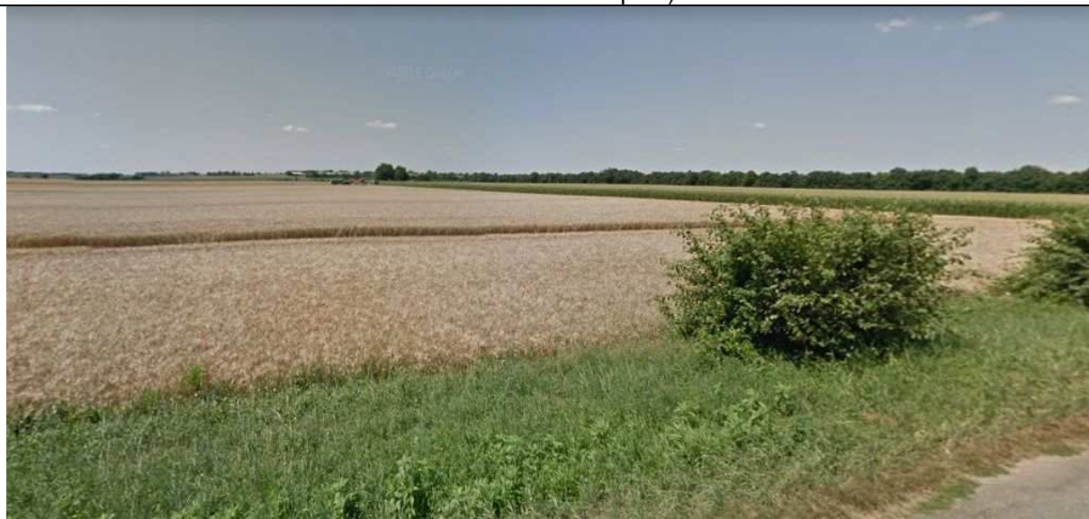
4 - Union Laitière de la Venise Verte Parcelle du plan d'épandage – vue depuis la route communale au nord de la parcelle GG13A