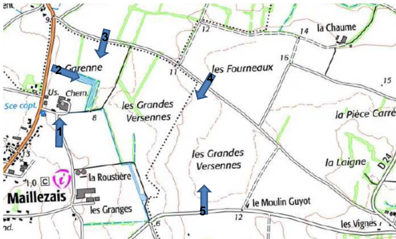
Localisation des prises de vue

Annexe 3 au Cerfa n°14734*03 Recueil photographique