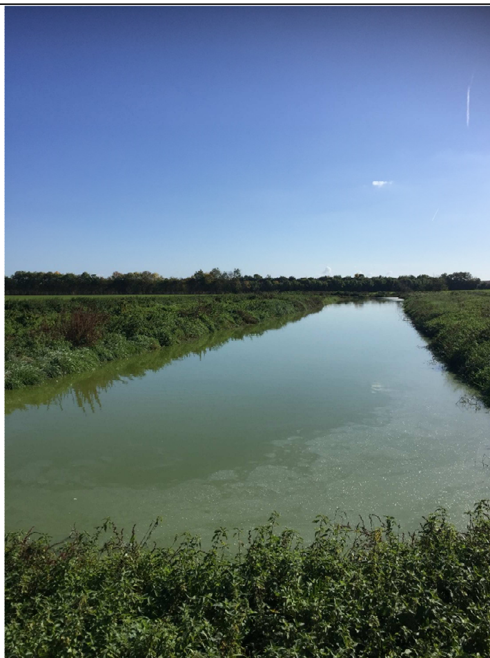
2 – Lagunage actuel de l'Union Laitière de la Venise Verte