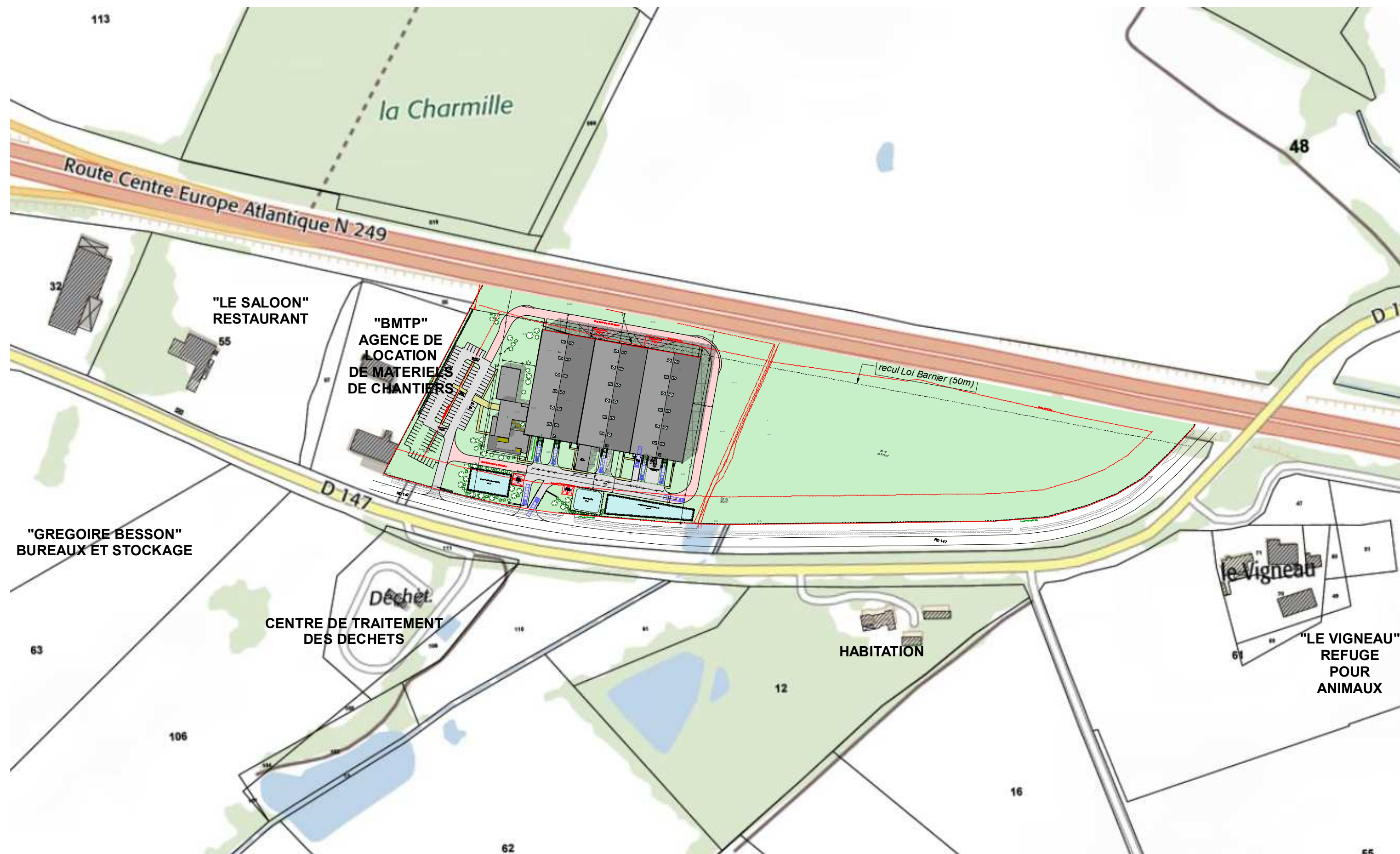
PLAN DE MASSE - 1/2 500