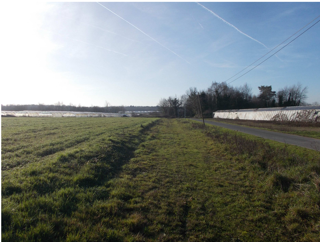
P2 : Photo du site