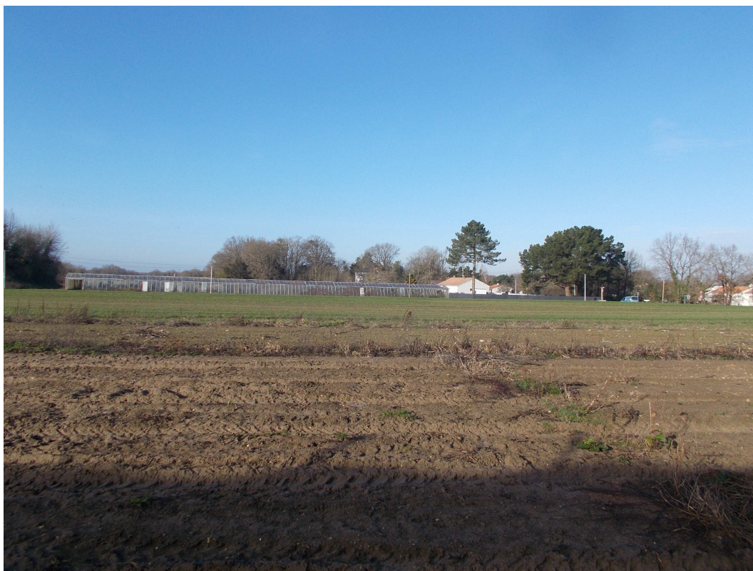
P6 : Photo du site