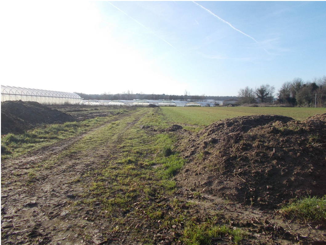
P4 : Photo du site