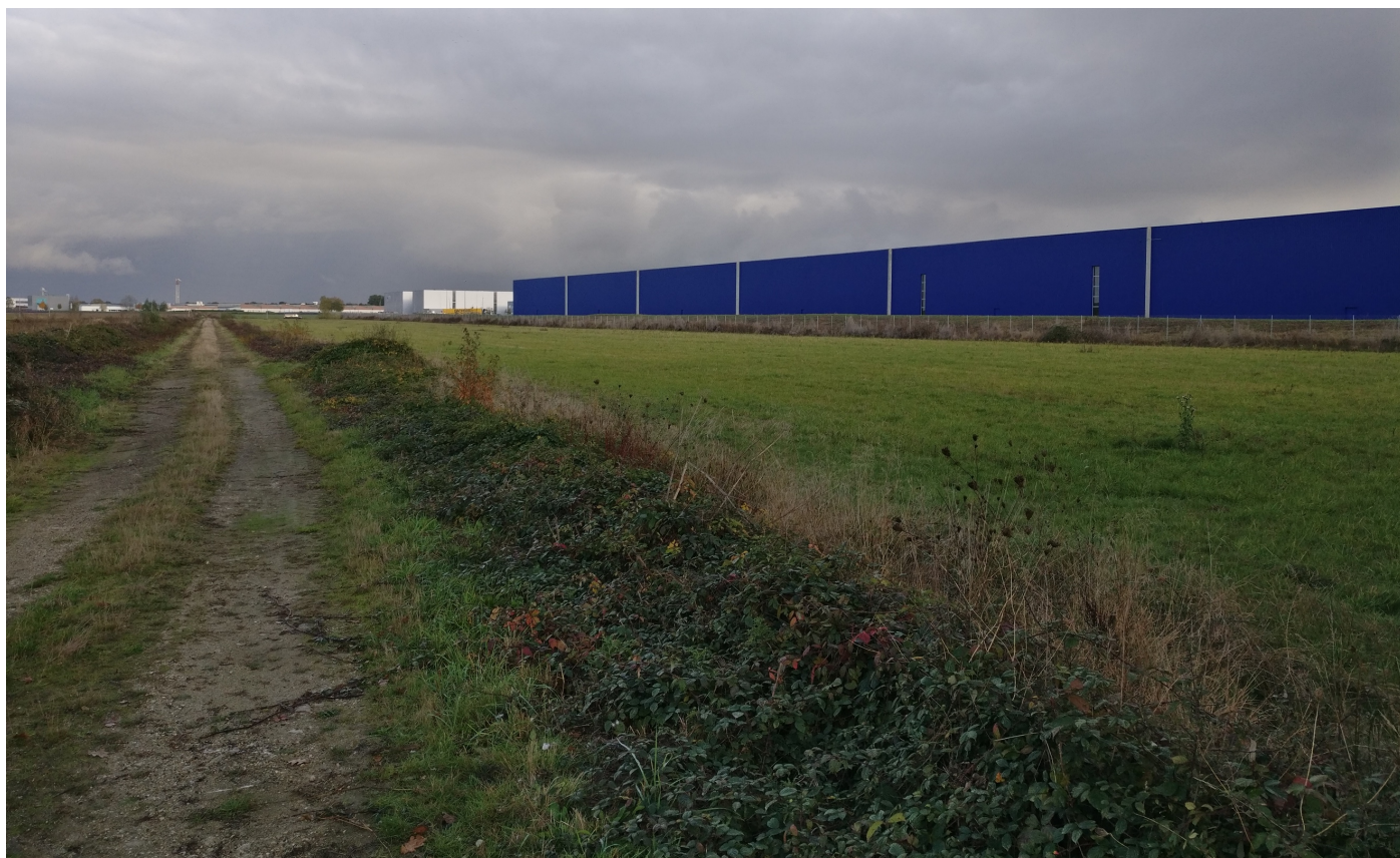
Prise de vue n°2