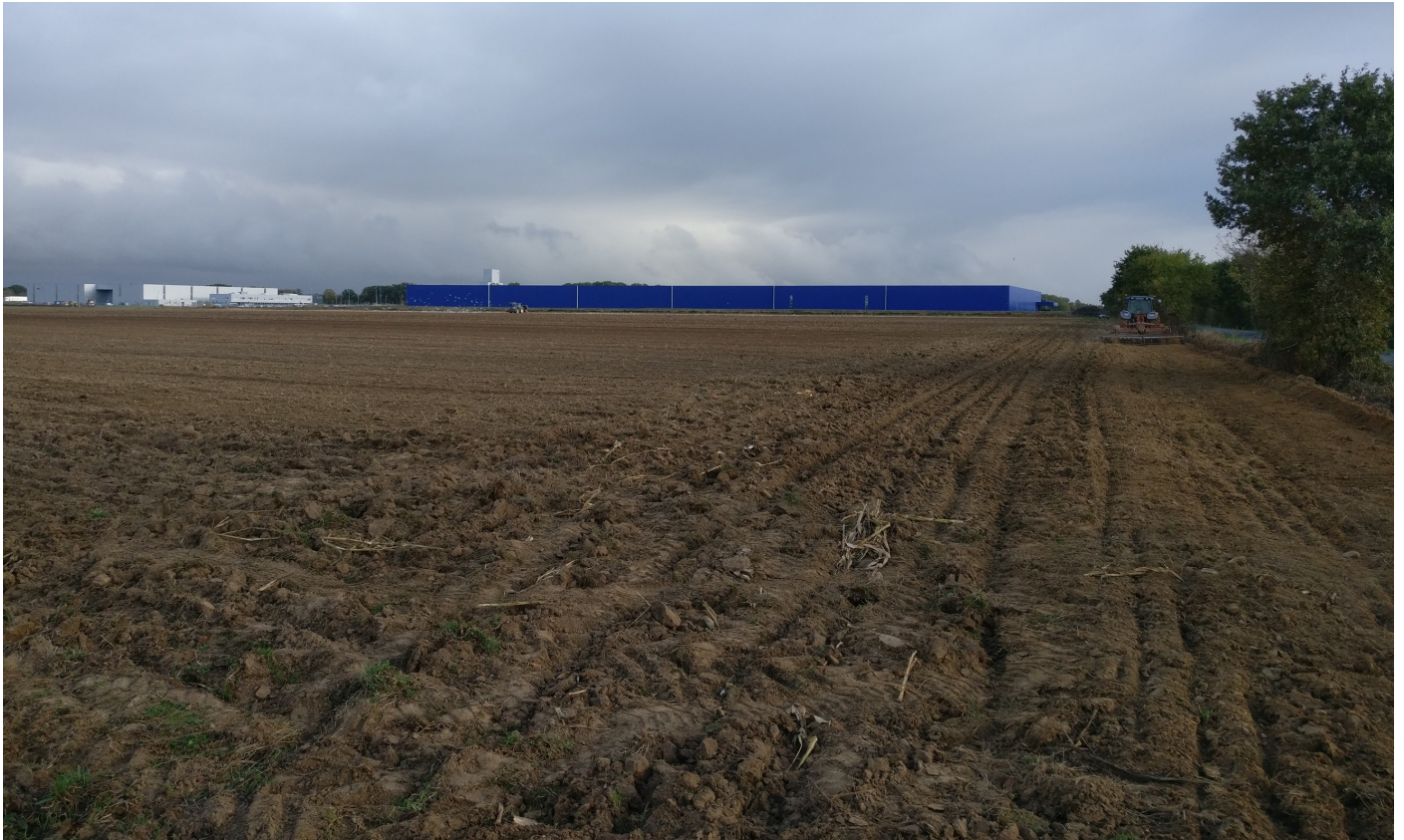
Prise de vue n°4