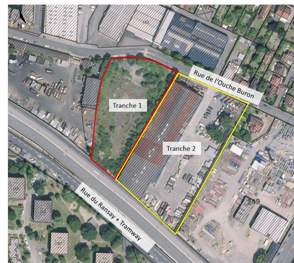
Figure 4 – Site du projet