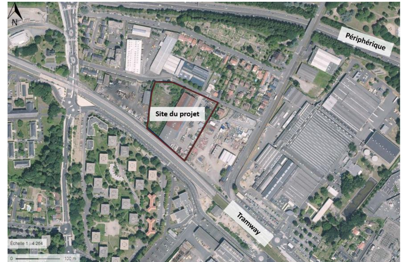
Figure 3 – Plan de situation du projet à l'échelle locale