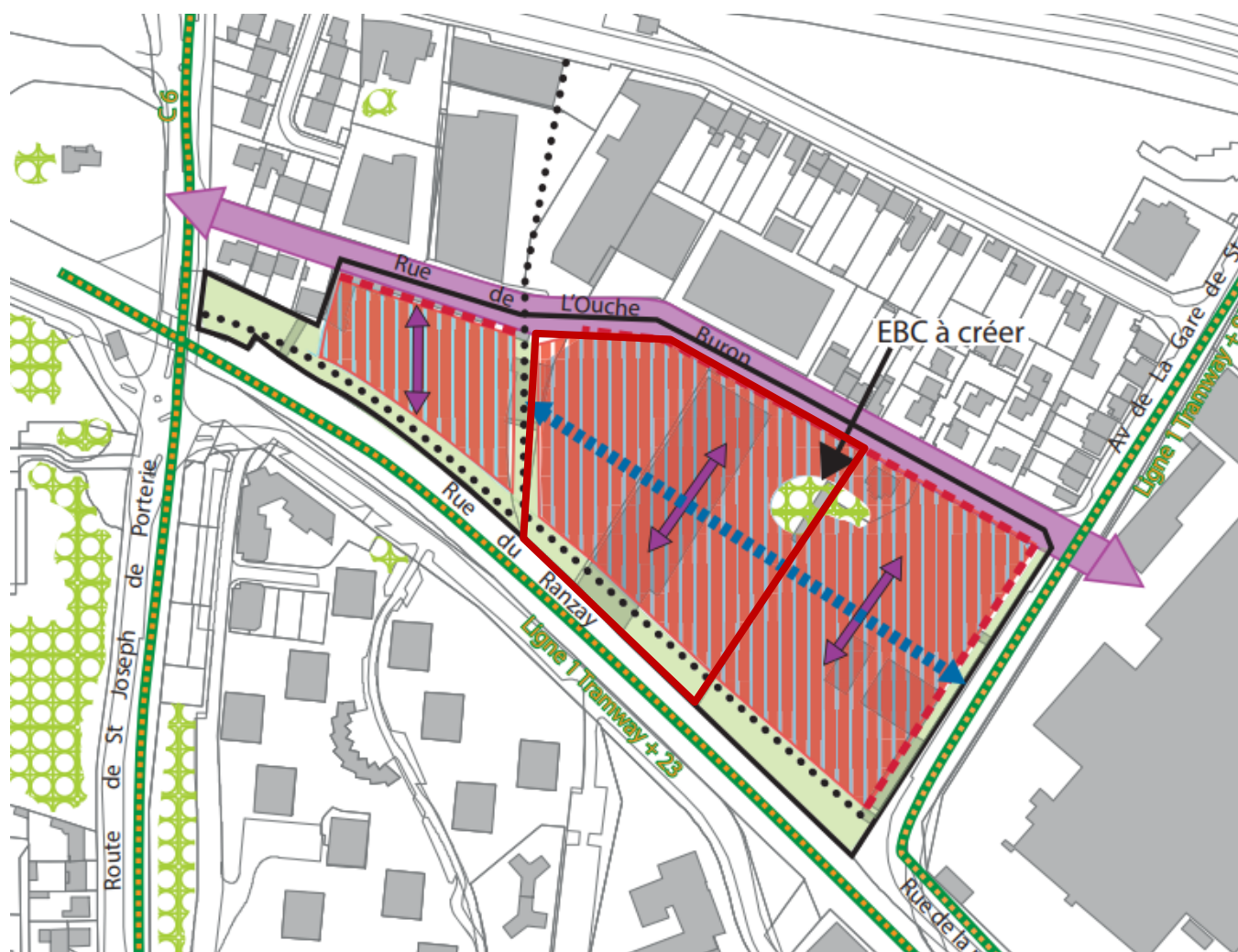
Figure 5 – Le projet au sein de l'OAP

— Périmètre des Orientations d'aménagement