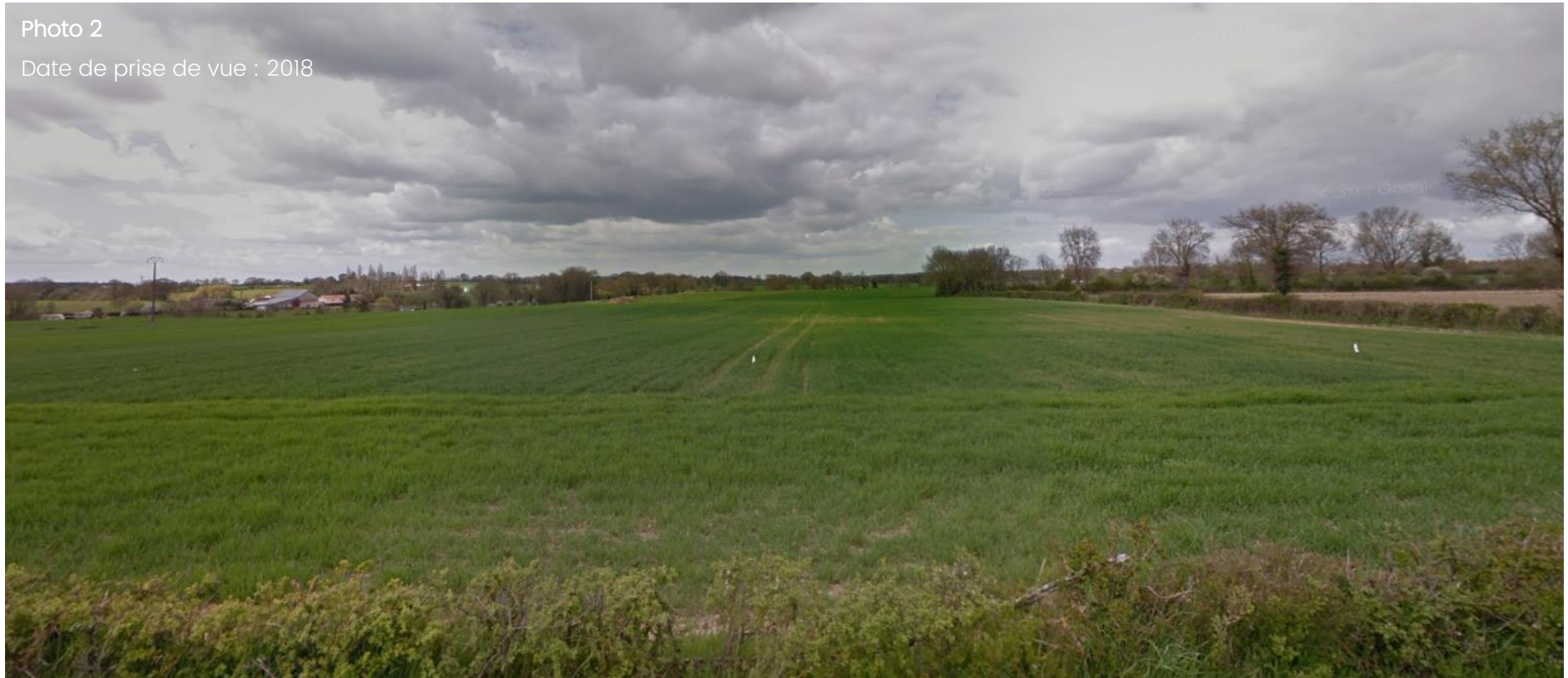
Figure 3 - Photo dans le paysage lointain