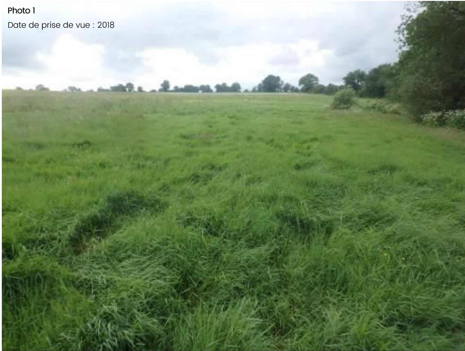
Figure 2 - Environnement proche