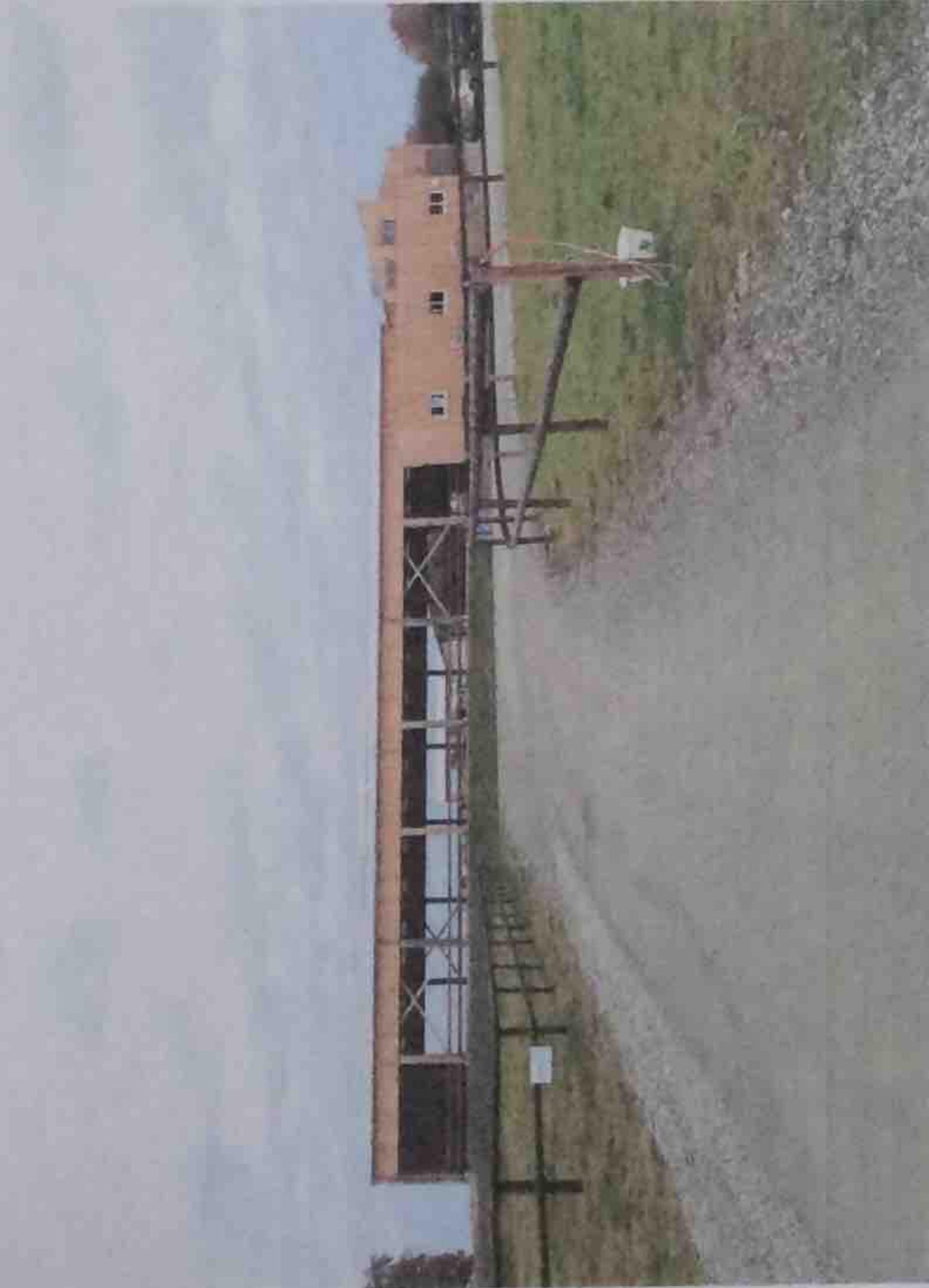
Accès parking- accueil