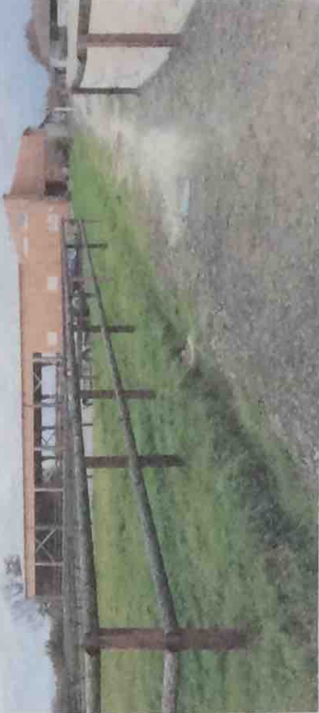
Manège- sellerie- logement