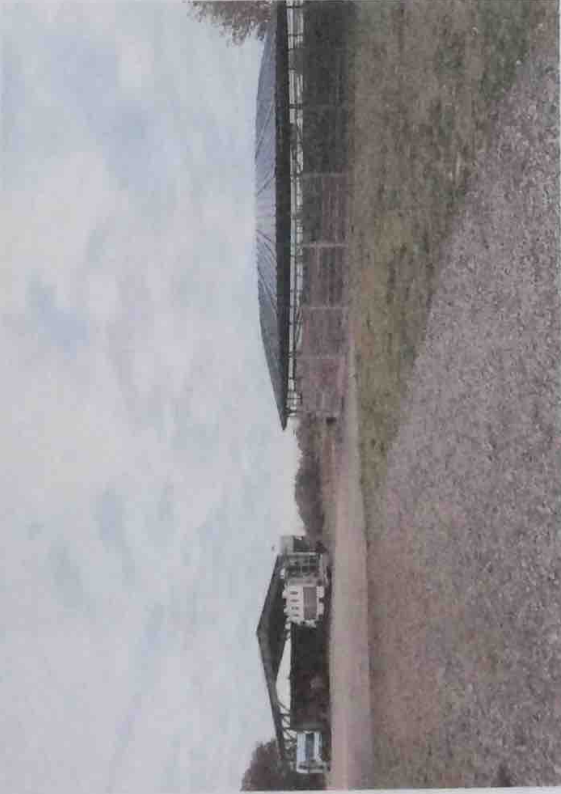
Fumière - Marcheur