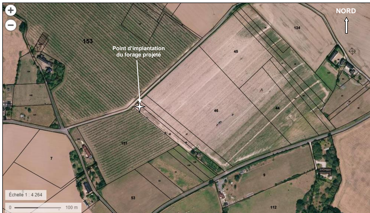
Vue du point d'implantation du forage projeté aux CHAMPS LONGS (BESSE-SUR-BRAYE – 72) sur photographie aérienne de l'IGN