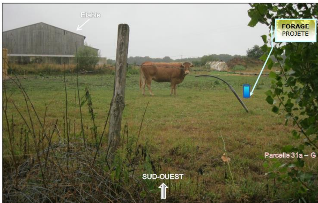
Point d'implantation du forage projeté à LA LEZERIE (PRECIGNE – 72)