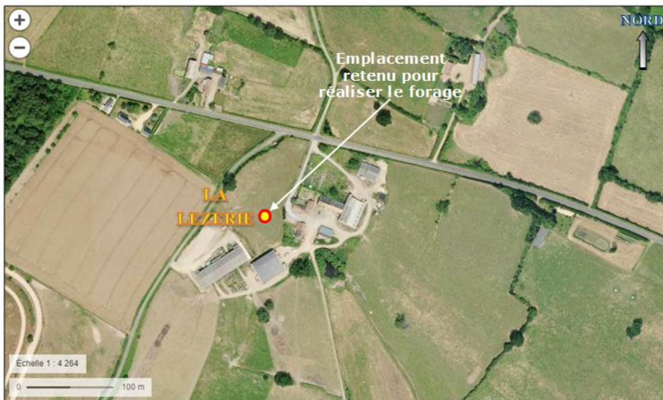
Figure 10 – Point d'implantation du forage projeté à LA LEZERIE (PRECIGNE – 72) sur un extrait de photographie aérienne de l'IGN