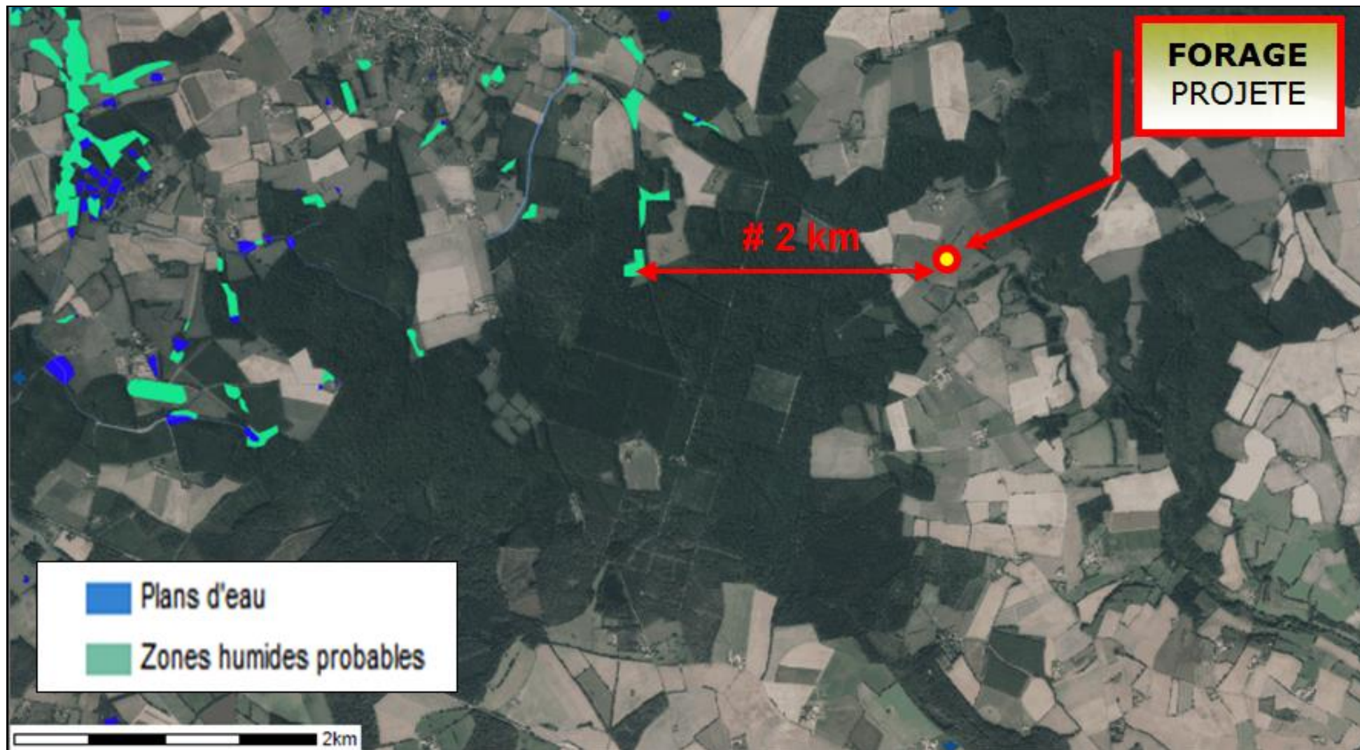
Situation du forage projeté au GRAND PRESOIR (MONTAILLE - 72) par rapport aux ZONES HUMIDES potentielles pré-localisées (Extrait du site : carmen.carmencarto.fr/70 )