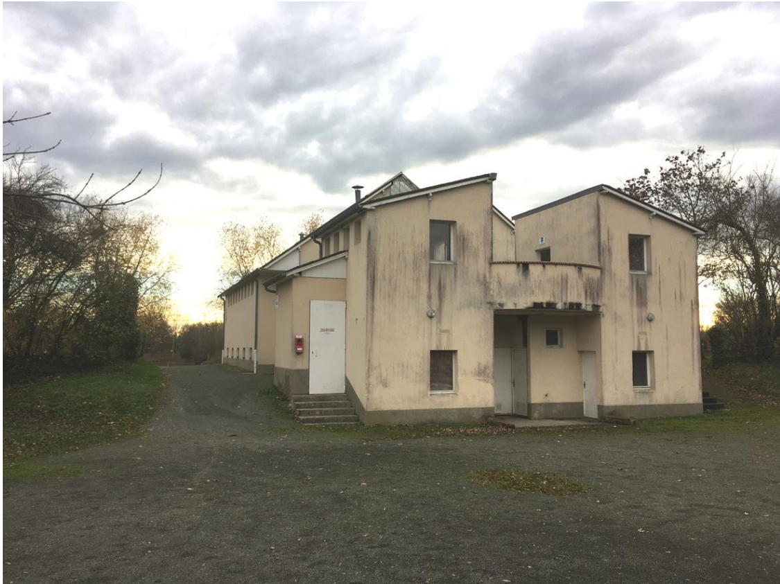
Photographie 4 - Vue proche