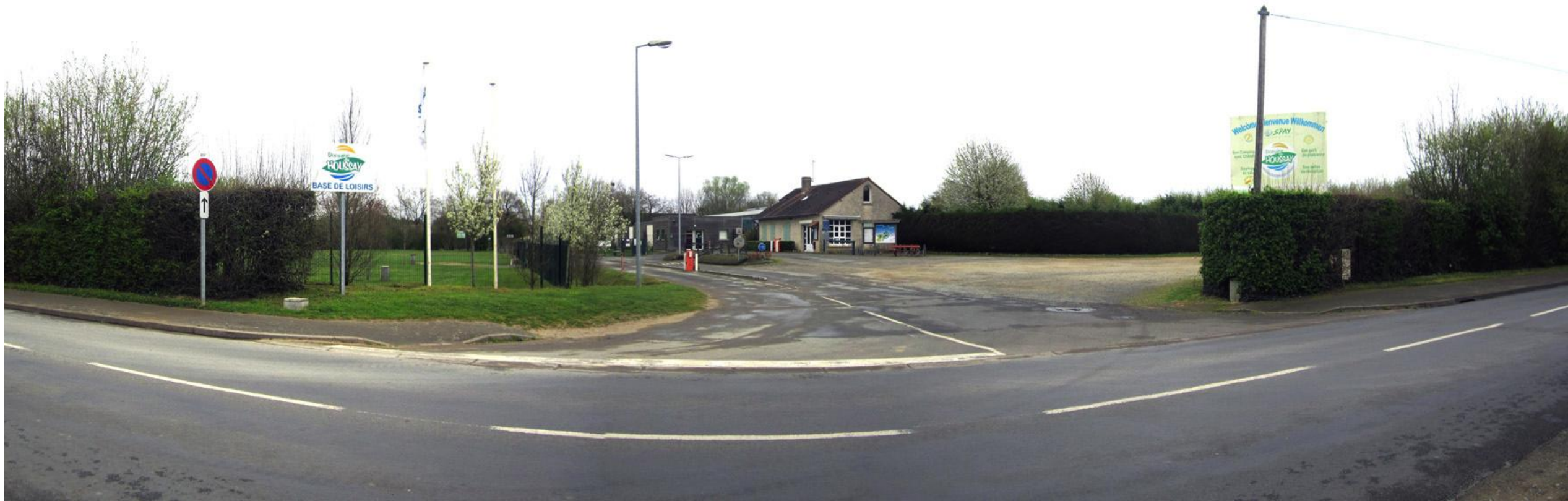
Photographie 1 - Vue lointaine