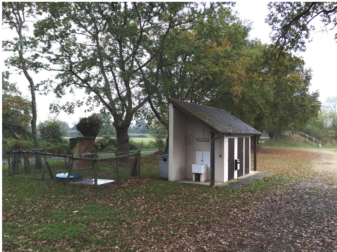
Photographie 6 - Vue lointaine