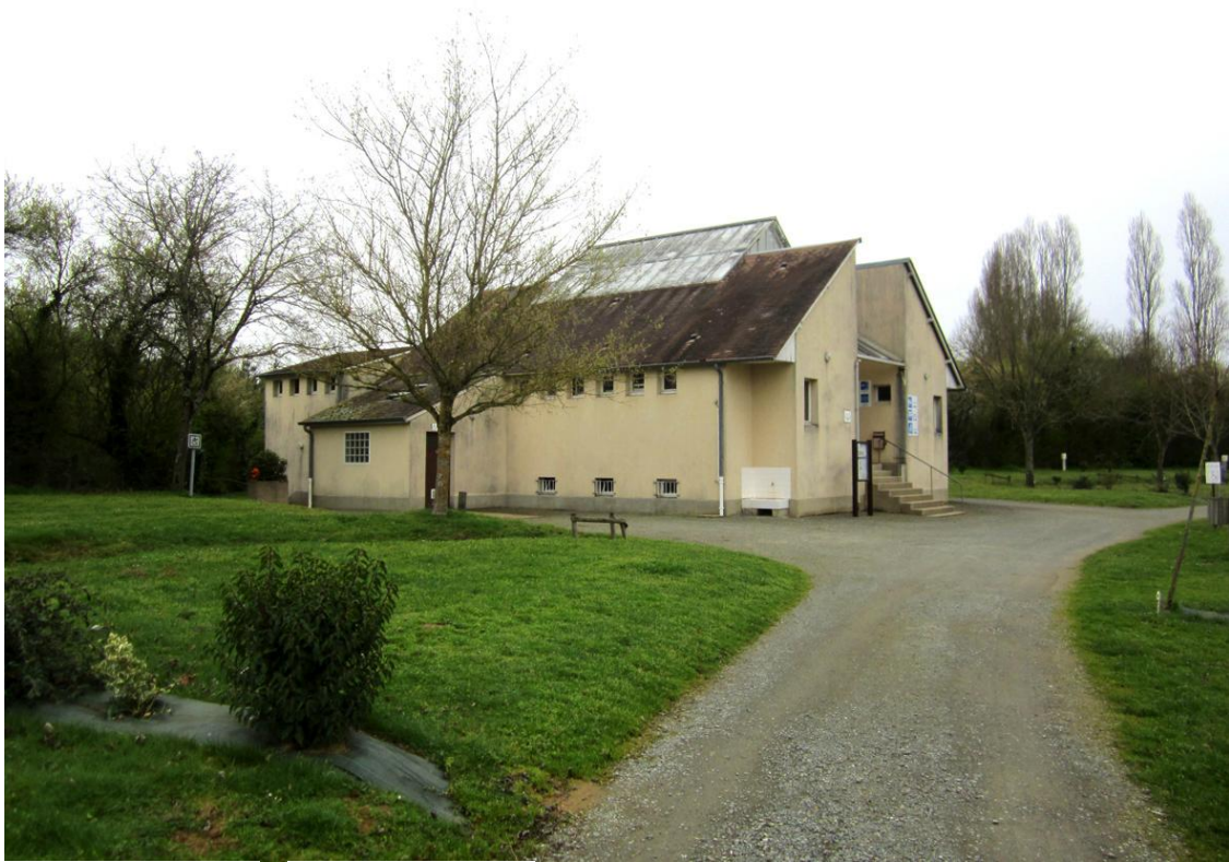
Photographie 3 - Vue lointaine