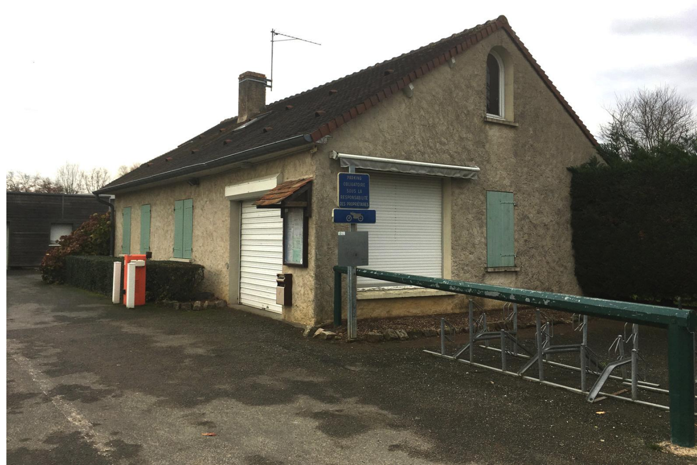
Photographie 2 - Vue proche