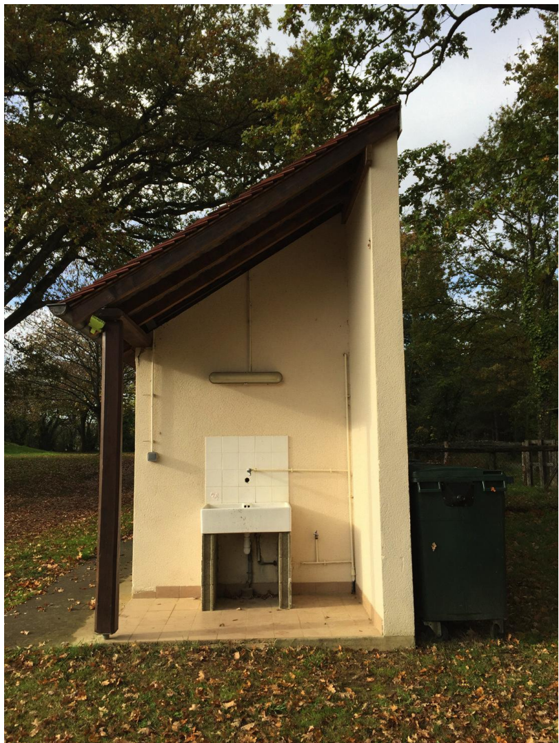
Photographie 7 - Vue proche