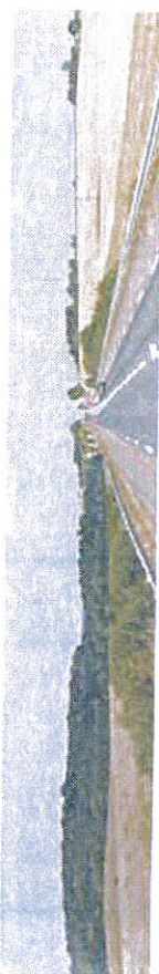
Photo montage : avec un écran boisé, la perception visuelle des boisement sera continue avec les boisements et bosquets existants.

Le long du futur barreau de raccordement à l'autoroute A11, les plantations devront permettre d'intégrer la zone tout en préservant l'effet vitrine sur les activités. Des boisements existants figurant en bleu sur la photo suivante doivent donc être préservés ; le carrefour giratoire d'accès sur la Rd 323 est bien visible.