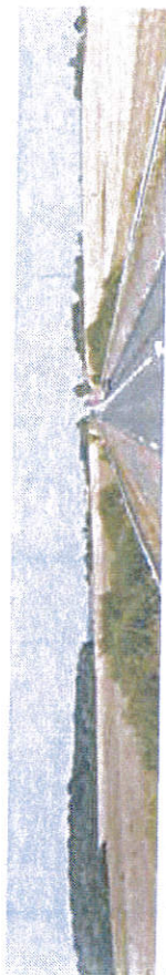
Secteur visible de la future zone d'activités

Pour intégrer l'urbanisation dans le paysage environnant, la future frange urbaine ouest sera traitée comme un écran boisé, en continuité des masses boisées que l'on perçoit en arrivant du Mans.