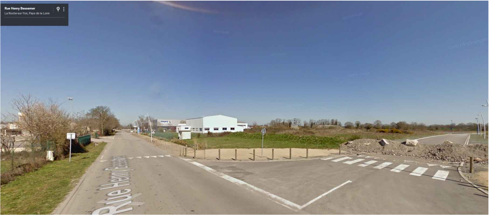
2- ENVIRONNEMENT LOINTAIN - juillet 2016