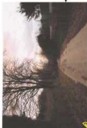
Céure dans la perception du secteur : au-delà de la ligne de droite : la descente vers la vallée boisée du Gesvres (en arrière-plan, en bout de voie), marque le paysage à un parcours plus champêtre (cf. alignements de chênaies, caractéristiques de ce paysage) contrastant avec la clôture artificielle de la propriété privée à droite.