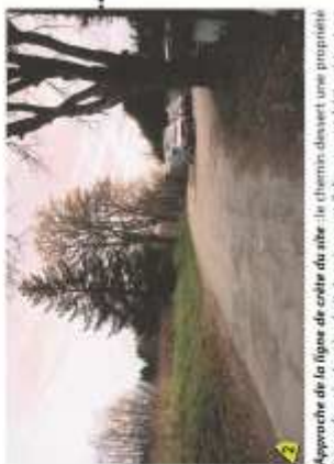
Approche de la ligne de crête du site : le chemin devant une propriété très rétrogradée sur la droite, qui rompt l'alignement bâti existant en arrière-plan, tandis que sur la gauche apparaissent les friches végétales composant le site au Nord-Est. A l'arrière de ce pré, émerge la masse opaque de fluyas qui marquent une écusson entre les parties Nord-Est et Sud-Ouest du site.