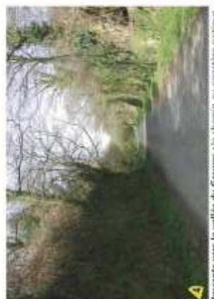
Descente vers la vallée du Gesvres : le chemin aux caractères ruraux, étroit, bordé de haies se fraye un passage entre de hautes talus arborés, créant un couloir visuel restreint, initiant une certaine tranquillité voire une ambiance intime, invitait à la promenade. La s talus étant toute possibilité de perception de "l'horizontalité" du site.