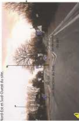
Arrivée sur le site depuis le centre de la Chapelle-sur-Endre : les voies de communication prédominent en sortie du quartier, le milieu urbain certes affaiblit l'alignement à gauche, maison d'habitation en alignement de voirie à droite. L'estampe une haie de prunus, les chênes à l'entrée du site soulignent l'entrée dans un secteur plus rural.