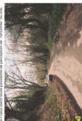
Approche de l'écote au sentier de promenade en vallée du Gesvres (sur la droite, au bas de la voie) : les volumes statonnés, de manière spontanée le long du chemin interrompu par le tracé de la RD 66 (en arrière-plan) marquent l'arrivée au sentier de promenade. La talus et le basament surplombant la voie et ceinturant le site (à gauche sur le cliché) créent des échos visuels et affirment le caractère champêtre du secteur. La vallée du Gesvres en contrebas tend à attirer le regard et l'attention du promeneur.