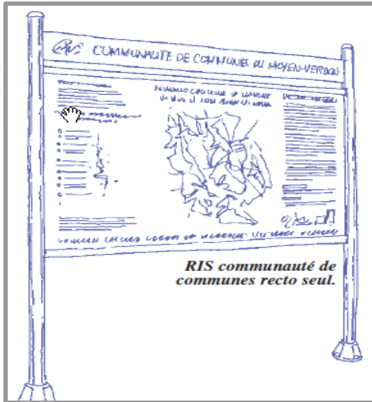
Le relais d'information service (RIS)