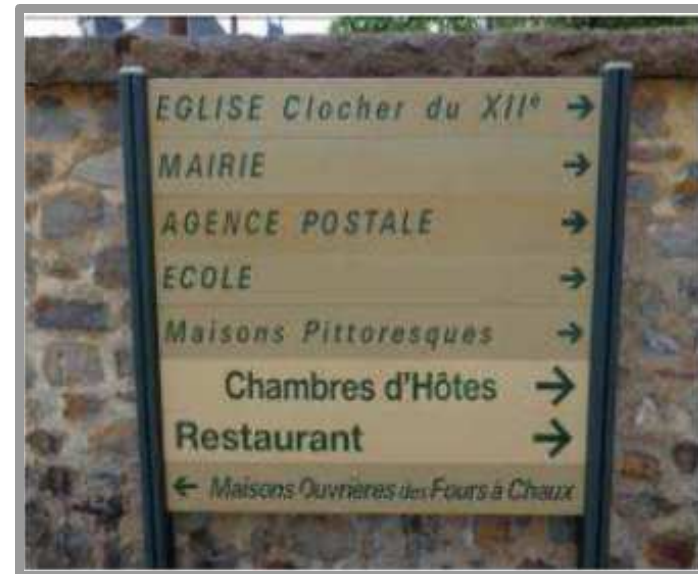
La signalisation d'information locale (S.I.L.)