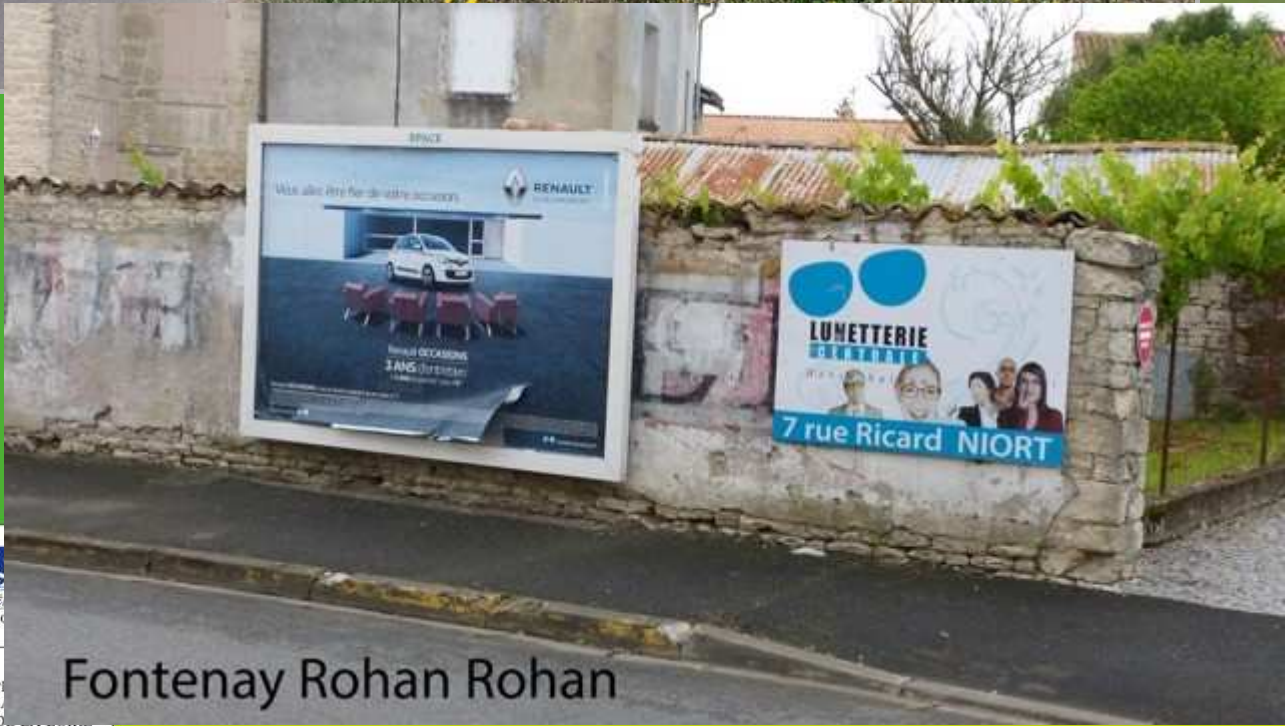
Fontenay Rohan Rohan