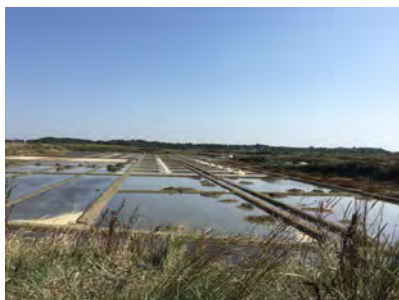
Les marais salants vers Beauregard, Mesquer

Des coteaux agricoles au relief peu marqué entourent le bassin principal et les vallons secondaires. Depuis les prairies de fond d'étier jusqu'au traict de Pen Bé, qui s'ouvre sur l'océan chemine le fleuve le Mès. Au cœur de ce paysage horizontal, les miroirs d'eau des claires ostréicoles et des salines dessinent un site remarquable.