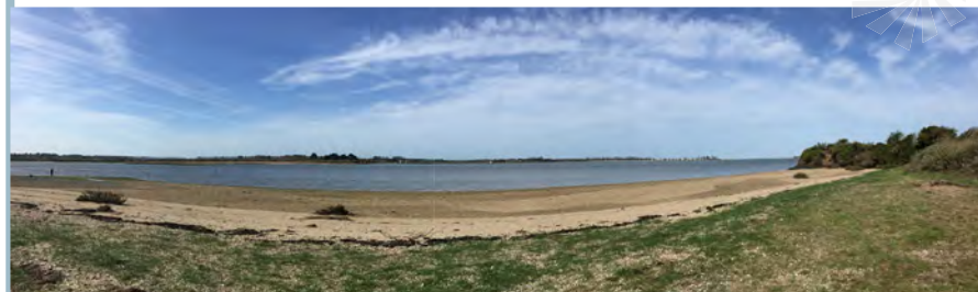
L'horizontalité du paysage sur le traict de Pen Bé depuis Kermalinge - Assérac

Aucune autorisation ne peut être tacite.