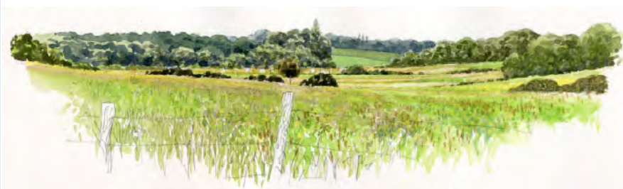
Les prairies de fond de vallon depuis le Grée d'Arm, Herbignac, © Denis Clavreul 2020