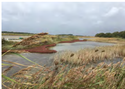
Une vasière à Boulay-Saint-Molf

Le classement de ce site discret et fragile, outre une reconnaissance nationale de ces paysages délicats, va permettre de préserver et de valoriser les activités salicoles et agricoles et de pérenniser la gestion extensive de ce territoire.