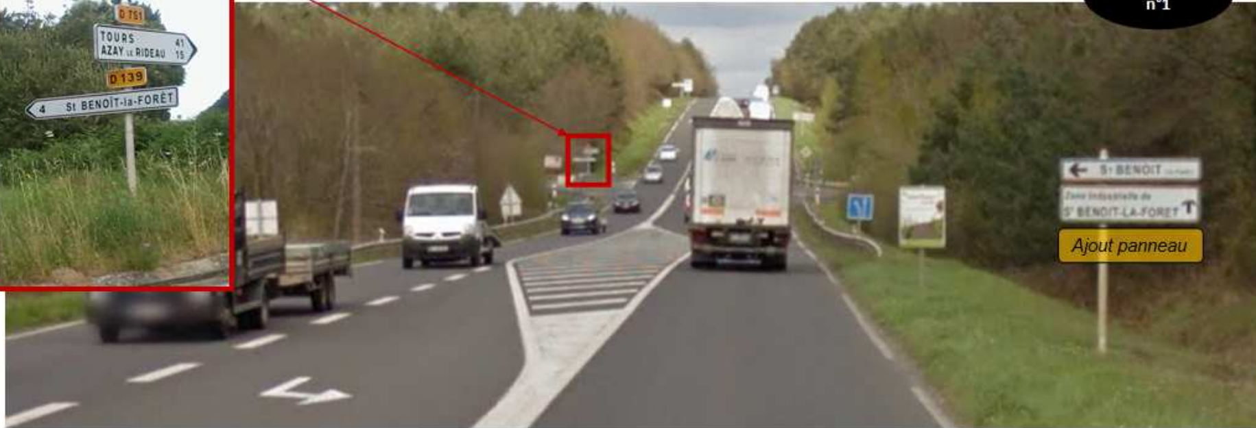
Arrivée depuis Chinon, intersection RD751