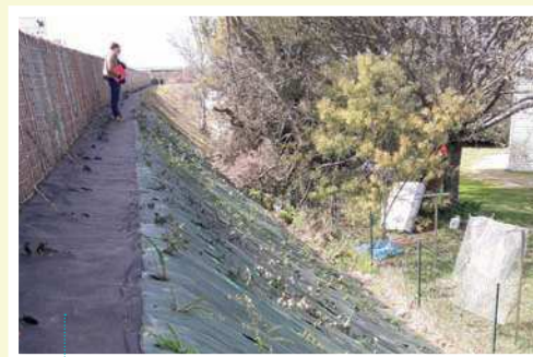
Bâche couvre-sol mise à l'arrière du merlon rehaussé