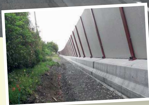
Arrière écran longeant la rue Jules Verne