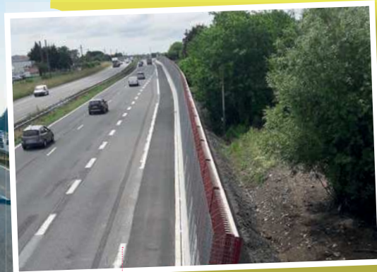
Extrémité de l'écran longeant la rue Jules Verne