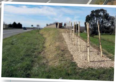
Travaux paysagers au niveau du merlon rehaussé