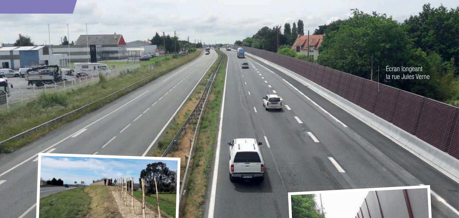
Écran longeant la rue Jules Verne