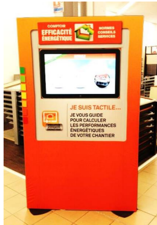
Borne Efficacité Énergétique