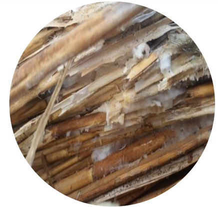
Champignon du genre Phellinus