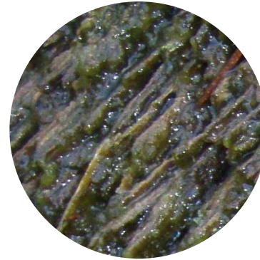
Cyanobactérie du genre Nostoc