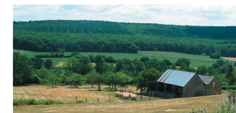
Conifères (régularité, densité) et feuillus (souplesse, clarté).