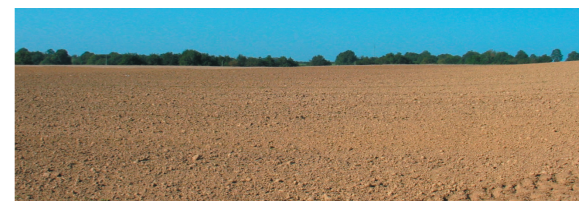
Rôle visuel de la couleur des labours.

La diversité géologique du département est liée à sa situation en transition entre Massif Armoricaïn et Bassin Parisien. Les paysages expriment cette diversité tout en nuances au travers des affleurements rocheux, du relief, des matériaux de construction du bâti traditionnel, des sols (couleurs des labours et cultures spécifiques), etc.