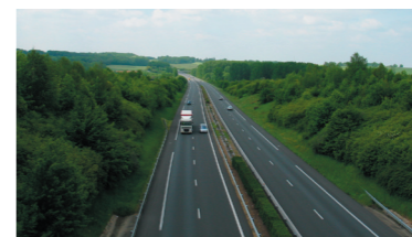
Autoroutes : une fenêtre ouverte sur les paysages.

Les voies de communication s'organisent autour du Mans (étoile autoroutière, etc.). Ce réseau (des autoroutes aux sentiers) constitue un mode de découverte des paysages de la Sarthe. Les axes principaux cristallisent l'urbanisation et les activités économiques, l'ensemble étant à l'origine de paysages en constante évolution.