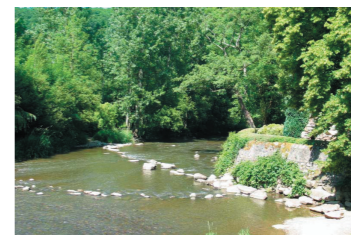
Intimité de la vallée de la Haute Sarthe.

Le chevelu hydrographique sarthois, dense, a façonné de nombreuses vallées aux morphologies variées. Certaines ont un caractère emblématique (Sarthe et Huisne confluant au Mans, Loir). Toutes concentrent et déterminent un patrimoine naturel, agricole et bâti particulièrement riche et représentatif de l'identité du département.