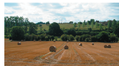
Alternance des cultures et des prairies.

L'histoire des terroirs détermine fortement les paysages actuels (bocage surtout préservé dans les terroirs à tradition d'élevage, etc.). Le parcellaire, la trame bocagère, les boisements et les cultures structurent les grands paysages ruraux. A plus petite échelle, une présence bâtie variée (villages, hangars, bâti traditionnel, etc.) s'exprime.