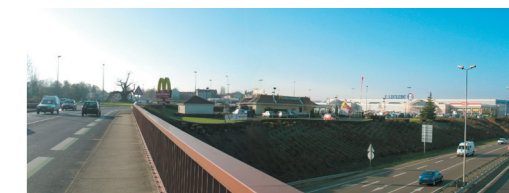
Paysages souvent confus des zones d'activités.

L'Atlas des paysages de la Sarthe a été largement diffusé auprès des différents acteurs locaux susceptibles de participer directement ou indirectement à l'évolution des paysages sarthois. Il est consultable dans toutes les mairies du département de la Sarthe sous la forme d'un CD Rom et sur les sites internet du Conseil général de la Sarthe ( www.cg72.fr ) et de la Direction régionale de l'environnement des Pays de la Loire ( www.pays-de-la-loire.ecologie.gouv.fr ).