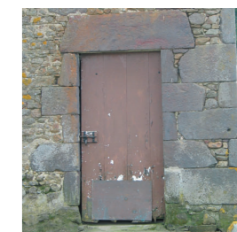
Importance du roussard dans le bâti traditionnel.