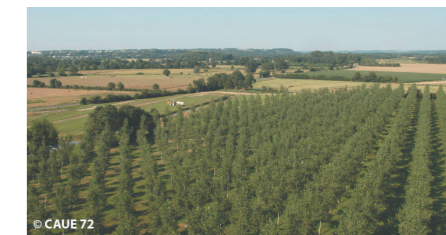
Fermeture et banalisation des vallées par les peupleraies.