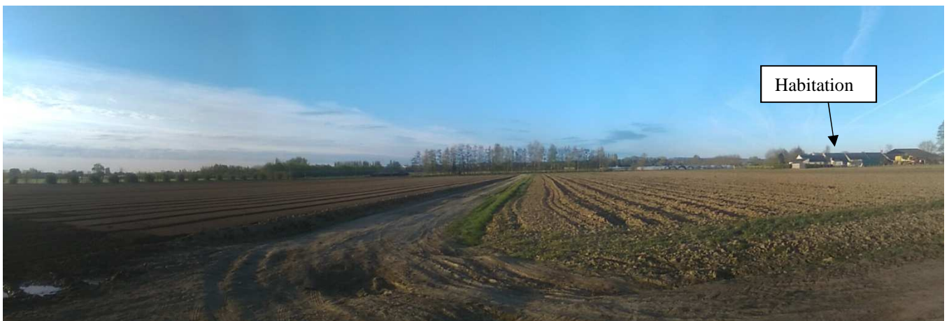
Panorama n°9 : photo de l'environnement abords Ouest