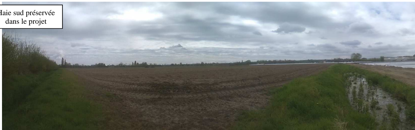
Vue n°2 : parcelle vue nord