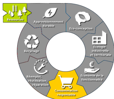
« Le modèle circulaire »

Domaine d'application et l'objectif des actions :