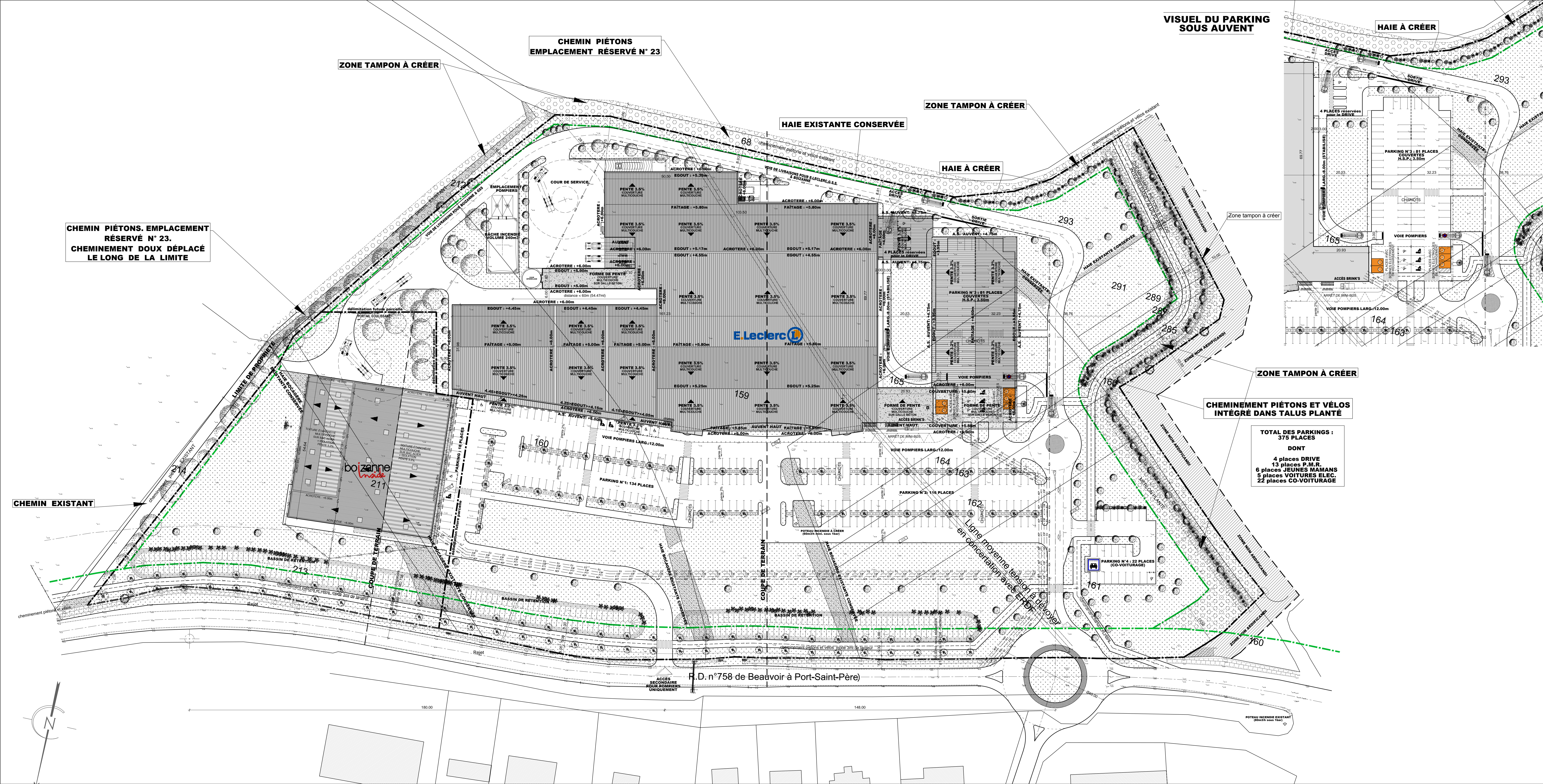
VISUEL DU PARKING SOUS AUVENT