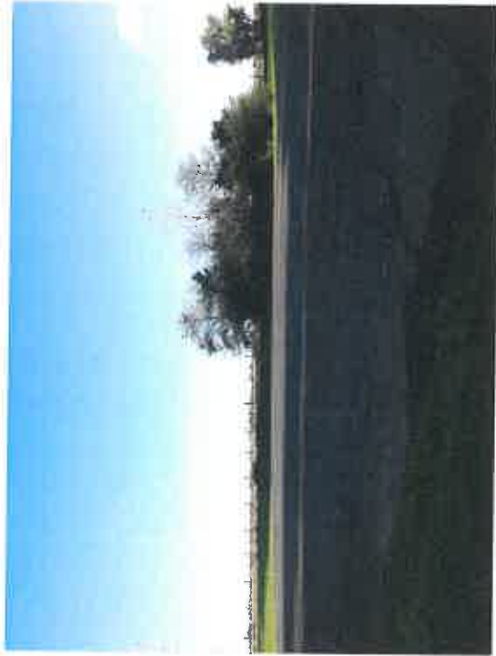
vue 1 (environnement proche)