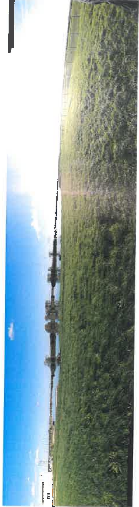
vue 3 (environnement proche)