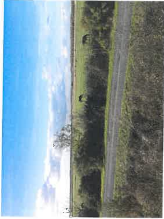
vue 2 (environnement lointain)