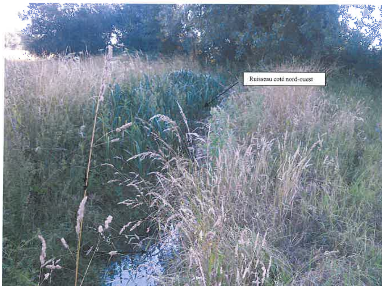
Photo de l'exutoire de la parcelle de la Giraudière