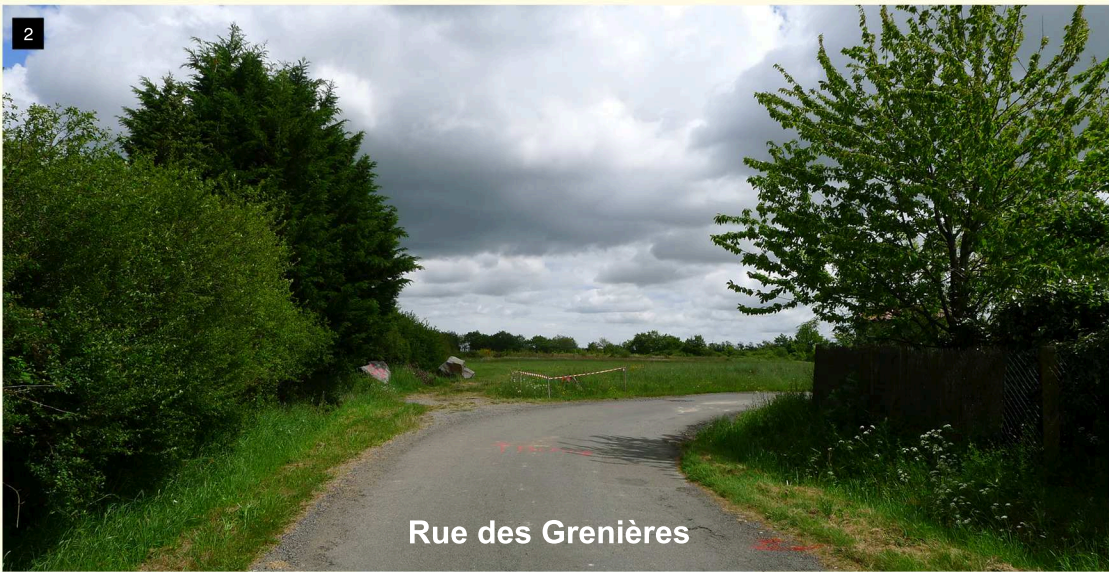
Rue des Grenières