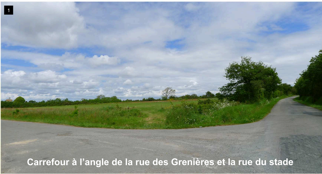
Carrefour à l'angle de la rue des Grenières et la rue du stade